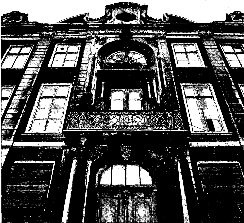
De verwaarloosde voorgevel van het Van Dishoeckhuis is nog geheel intact. De rijk gedetailleerde ingangspartij met de beelden van Pallas Athene en Mars: Vrede, waarin cultuur gedijt, de God van de Oorlog overwinnend.

de kunstgeschiedenis belangstelling gekomen voor dit lang verwaarloosde onderdeel van de decoratieve kunst.