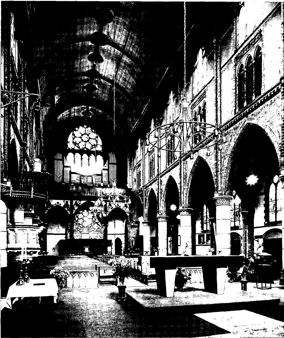
St. Vincentiuskerk, Jacob van Lennepkade, ontwerp: C. P. W. Dessing, 1900. Een gemiddeld neogotisch interieur, redelijk gaaf bewaard. Ook voor deze kerk, die als stedenbouwkundig accent een belangrijke functie voor de 19de-eeuwse Kinkerbuurt heeft, dreigt sloop indien er geen andere oplossing wordt geboden voor de noodlijdende parochie.

tenzorg de mogelijkheid tot bijdragen in de herstelkosten van 19de-eeuwse kerken aangekondigd. 6 De plannen, om de restauratie van de Vondelkerk aan te vatten, waarvoor toen ook subsidie verleend werd, gaan op dit voornemen terug, evenals de restauratie van de St. Nicolaaskerk. Door de geringe zekerheid over de toekomst van de Vondelkerk als centrum van zielszorg zag het kerkbestuur echter van de restauratie af, waarna het eerste bedrijf van het treurspel Vondelkerk geopend was.