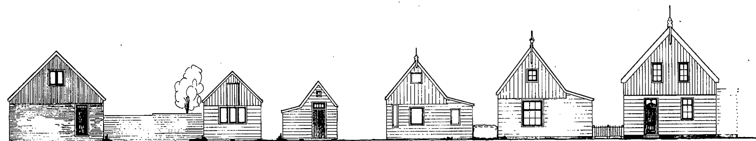
Domineestuin Straatgevels Zuidzijde