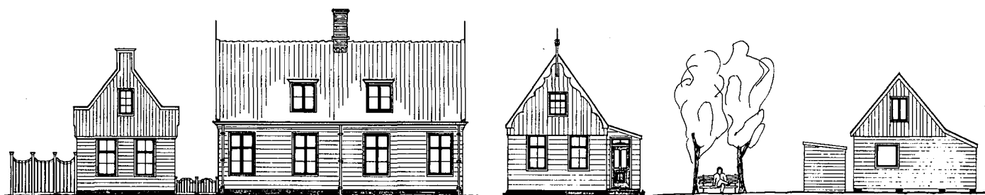
Domineestuin Straat gevels Noordzijde