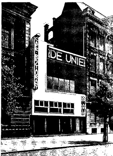
Café De Unie uit 1925, zoals het stond aan het Callandplein, evenals de directiekeet van Oud uit 1923, bedoeld als tijdelijk onderkomen. Het café, in kleur- en vormdynamiek één van de meest gedurfde voorbeelden van de Stijlarchitectuur, zal binnenkort worden herbouwd aan de Mauritsweg te Rotterdam.

De directiekeet wordt geheel uit de oude context gehaald – de plaats staat overigens nog niet geheel vast – om als horecakijsk op de Westblaak te fungeren.