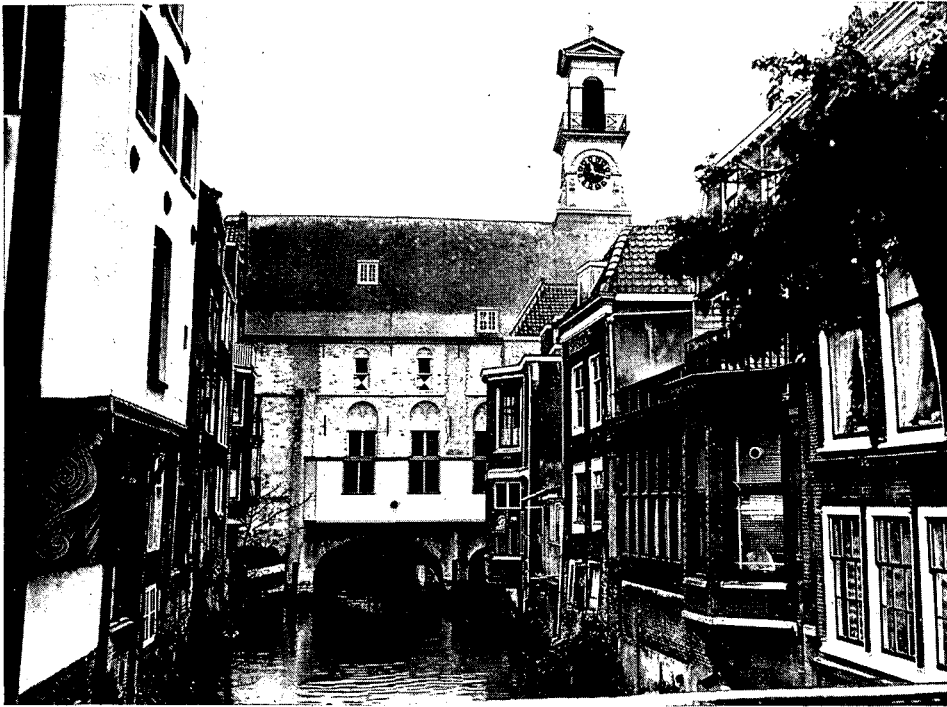
De achtergevel nu. De drie bogen verraden het van oorsprong middeleeuwse gebouw. In de loop der tijden is er veel aan deze gevel veranderd.