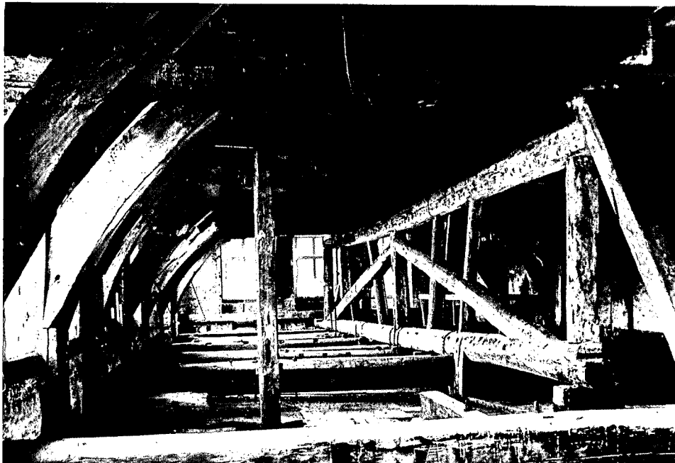
Zo zag het er vóór de restauratie op de kapverdieping uit: noodconstructie om het verder doorzakken van de vroeger verkeerd aangepakte toren tegen te gaan.

Bij de werken aan en in de Oude Haven (waaraan Dordrecht is ontstaan) ging het in