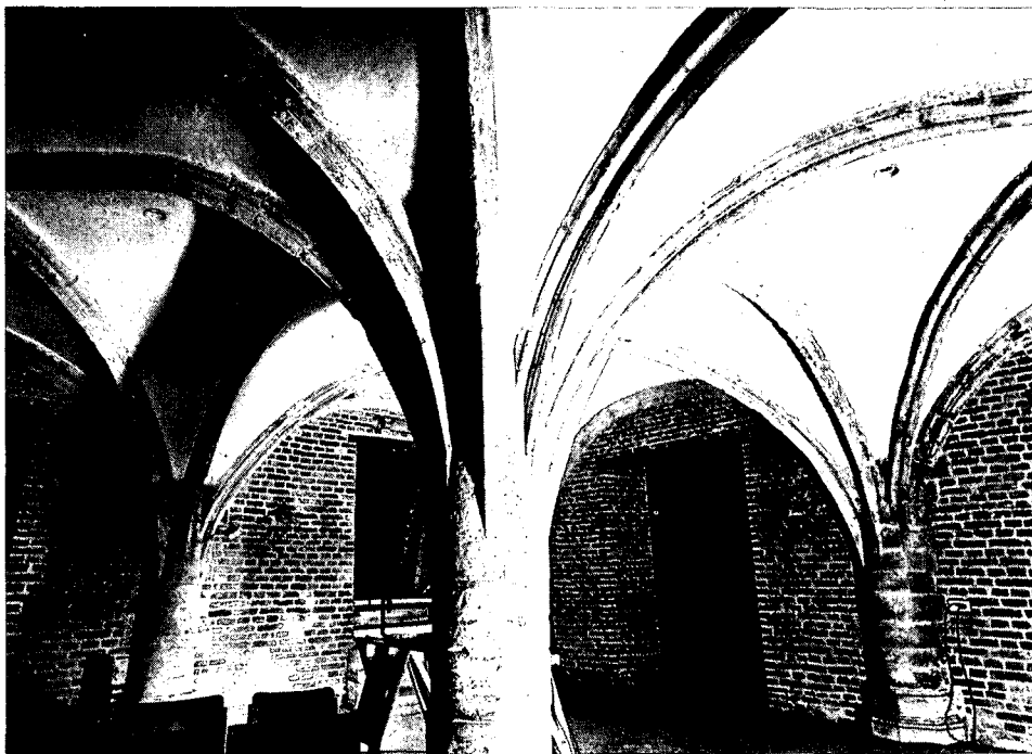
De herstelde middeleeuwse raadskelder. Weliswaar is de kelder verpakt in een waterdichte, betonnen kuip, maar daarvan valt niets te zien. Aardige combinatie van nieuwe en oude bouwtechniek.

het bijzonder om het herstel van de kademuren, en dat zijn dan de muren van het stadhuis zelf omdat dit aan de landzijde (Voorstraat) onderdeel is van de Dordtse waterkering. Door het inklinken van de bodem en onder invloed van de hogere waterstanden geraakte het onderhuis, waarin nimmer een waterkerende vloer was aangebracht, in de problemen en was het reeds lang buiten gebruik gesteld. De ernstige aantasting van de kademuren is te wijten geweest aan extra ophogingen van de Voorstraat als waterkerende dijk en de schurende werking bij ijsgang mede door het grote getijverschil vóór de bouw van de Haringvlietdam.