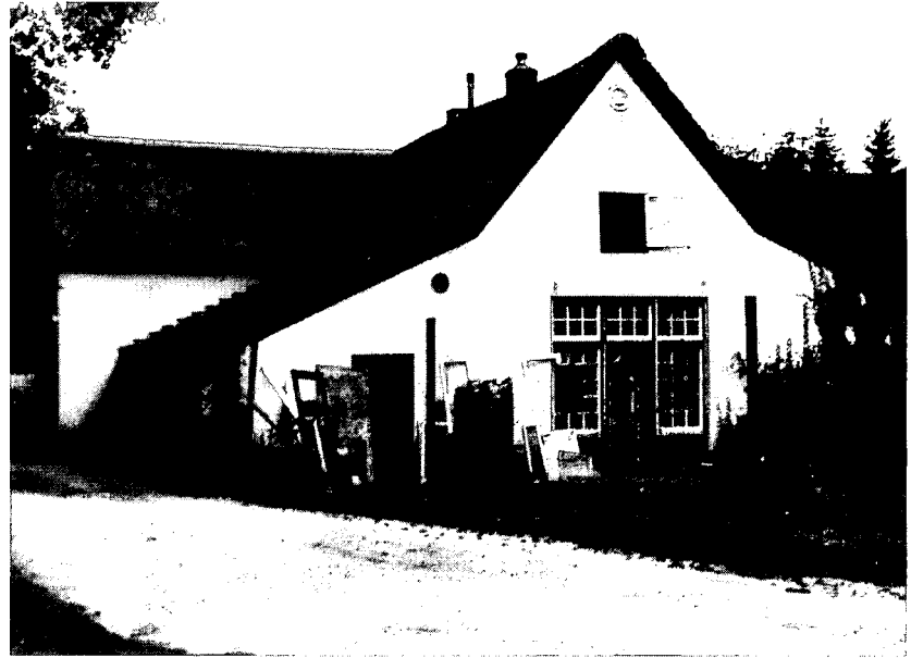
Achterzijde van 'De Woeste Hoeve'. (foto Abele Reitsma).

De kudde schapen op de weg laat zien, dat er toen nog nauwelijks van verkeer sprake was. Het landschap was nog vrij kaal. Thans is de hoeve omgeven door bospercelen en groepen van zware loofbomen die suggereren dat zij ouder zijn dan honderd