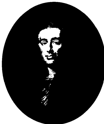
Hans Willem Bentinck (1649-1709), heer van Rhoon. Bentinck werd in de Westminster Abbey in Londen begraven.