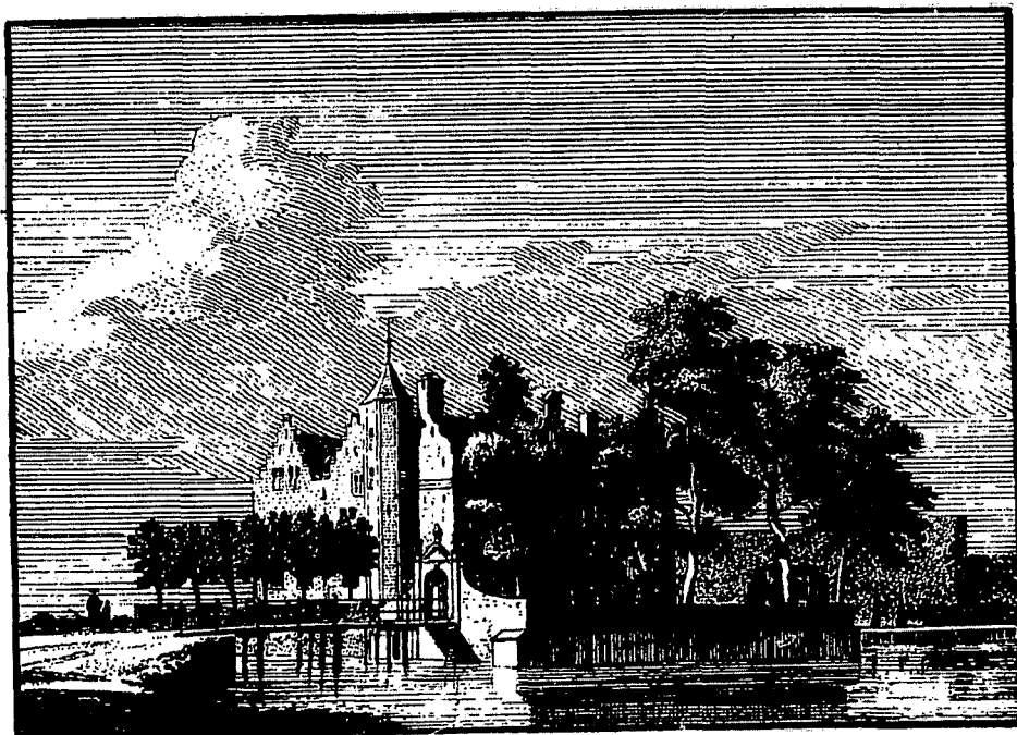
Huis te Rhoon in 1740, van rechtsaf gezien, met hek en toegangspoort.

Er is wel eens vermoed dat het door zijn machtige buur ontzien werd, hetzij om zijn respectabele leeftijd, hetzij om zijn aanwezig landelijk schoon of fraaie cultuurschat, het kasteel van Rhoon.