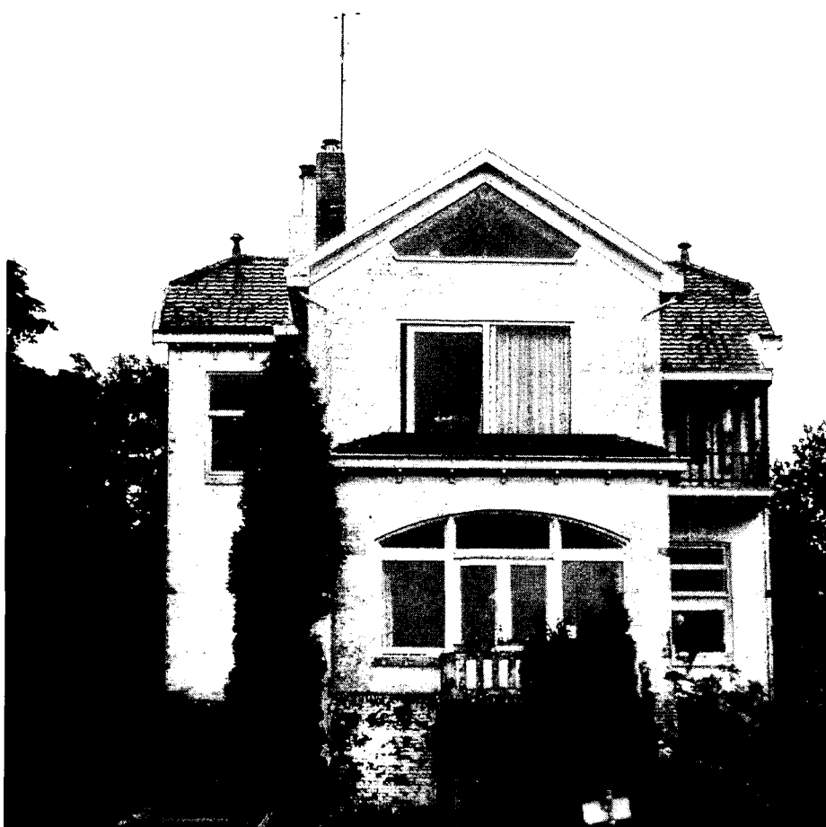
Voorgevel Villa Weltevreden.

Eigendom Natuurmonumenten 'Weltevreden' werd in '88/89 opgenomen in de voorlopige inventarisatie in het kader van het Monumenten