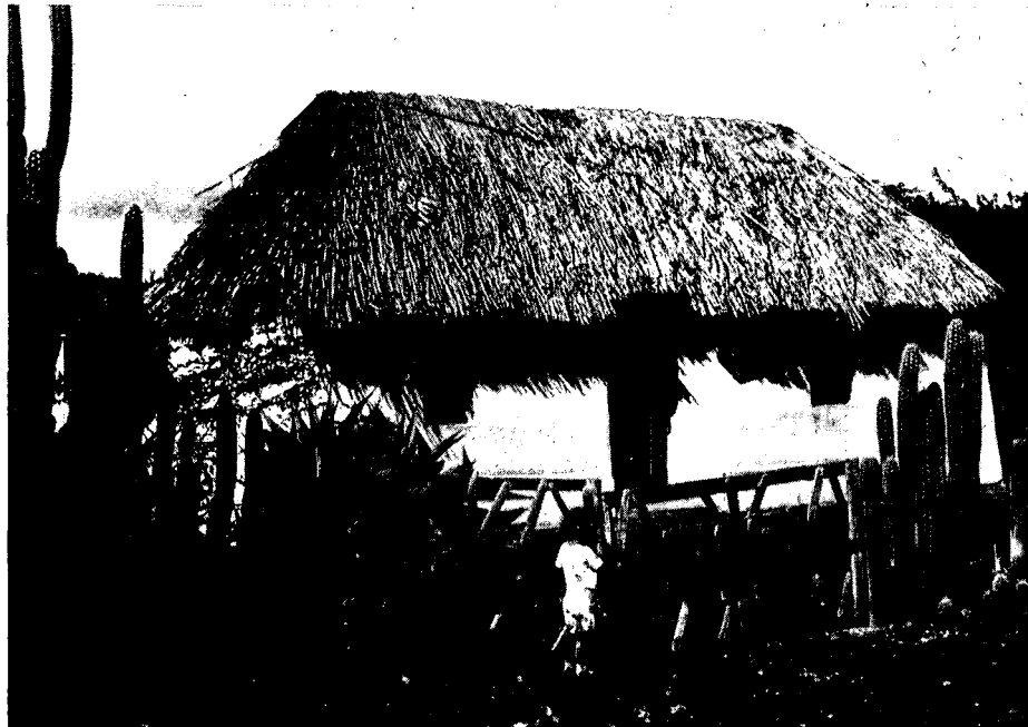
Knoekoehuisje op de weg naar West Punt. Verworven door de Stichting Monumentenzorg en in 1985 gerestaureerd. Het golfplatendak werd vervangen door het traditionele rieten dak. Waarschijnlijk is dit het laatste betrekkelijk gave voorbeeld van een slavenwoning, nu ingericht als 'museum'.