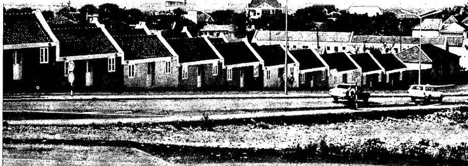
Berg Altena, Willemstad, Curaçao. Arbeiderswoningen uit de tweede helft van de 19e eeuw. Deze werden onlangs gerenoveerd en gerestaureerd in een samenwerkingsverband tussen de Stichting Volkswoningbouw en Stichting Monumentenzorg Curaçao.