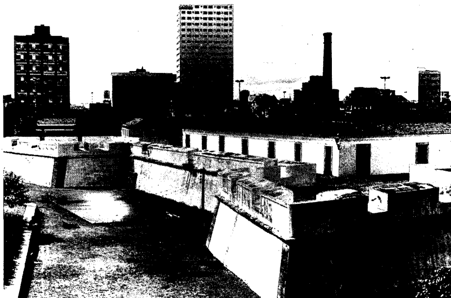
Zijaanzicht van het fort das cinco Pontas in Recife. Het werd door de nederlandse ingenieur Commersteijn in 1630 gebouwd en naar Frederik-Hendrik genoemd.

Wanneer vanwege het geldelijk gewin Hollanders op een plekje ergens op de wereld hun oog lieten vallen, was een van de eerste dingen die ze deden er een fort bouwen. Hun handelsbelangen moesten immers goed beschermd worden!