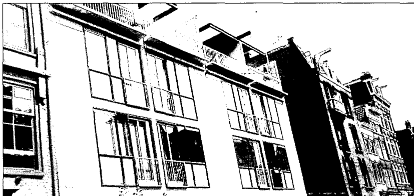
Nieuwe appartementen in de Kerkstraat, gebouwd door Cees Dam.

Zo rust er een zware verantwoordelijkheid op een welstandscommissie bij haar beslissingen of een bouwplan wel past in het bestaande stadsbeeld. De vraag rijst nu of de welstandscommissie zelf wel voldoende inzicht heeft in het zo typisch Amsterdamse karakter van het te beschermen stadsgezicht: is er nog