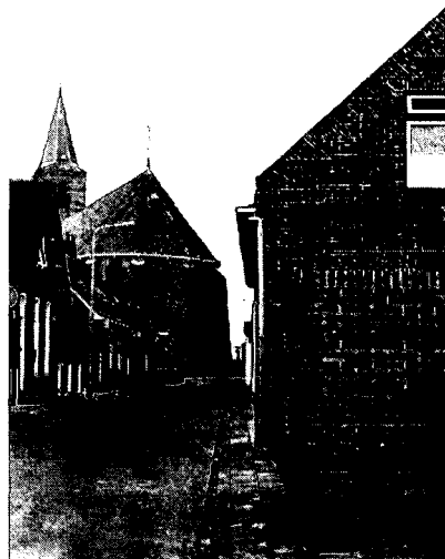
Verstoord dorpsstraatje in Anjum.

wegen richting kerk. De oudste delen liggen ten noorden van dit bedehuis. Het centrale gebied rond kerk en oudste deel van deze nederzetting is beeldbepalend.