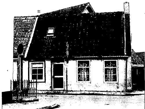
Misplaatste renovatie van dorpswoning in Anjum.

Dat je naast goede oplossingen vaak ook lelijke nieuwbouw ziet, bleek tijdens onze rit langs en door kleine Friese dorpen ten noorden van Dokkum. Er is soms sprake van 'rammelende' bebouwing. Anjum ziet er wat dat betreft sfeerloos en verknijpt uit. Extra subsidie leidt vaak tot nostalgi-