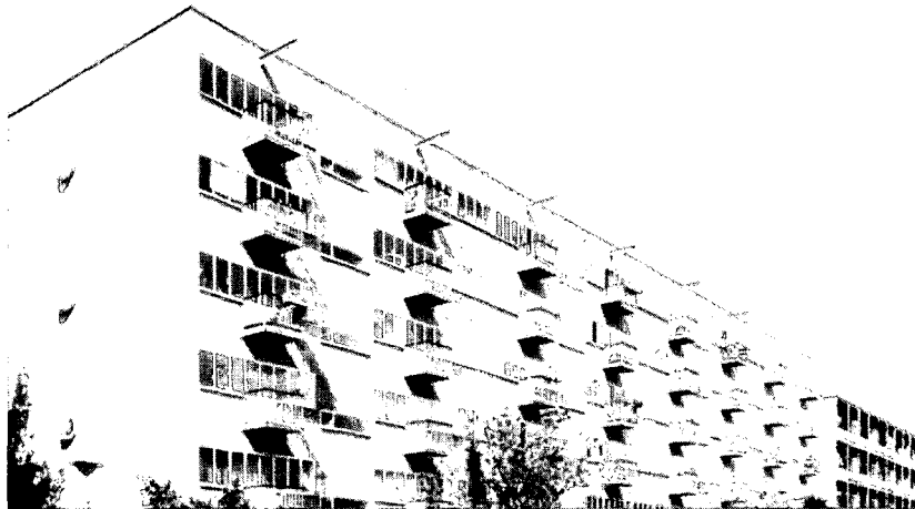
De 'atelierwoningen' aan de Zomerdijkstraat.

H. Knijfizer, architect BNA, Amsterdam, 3 januari 1991.