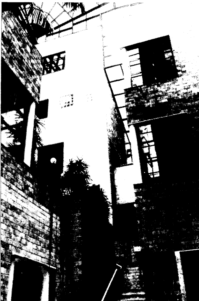
Hert kantoor van het Rijks Oudheidkundig Bodeminstituut te Amersfoort

'Dat is voor mij onbegrijpelijk. Een stadsbestuurder is geen technisch bestuurder. Daar heeft een stad geen behoefte aan. Zeker een stadsbestuurder voor ruimtelijke ordening, stadsvernieuwing, volkshuisvesting of monumentenzorg moet opvattingen over architectuur hebben. Hij hoeft niet per se de architecten aan te wijzen, maar wel kunnen onderscheiden welke plannen hoogwaardig zijn. Het Kamer van Koophandel-gebouw zou door een bestuurder tegengehouden moeten worden. Het liefst in een vroeg stadium, maar een bestuurder zou ook de moed moeten hebben om te zeggen: graag de KvK op die plek, maar het is onaanvaardbaar dat het beeld van Amsterdam op die manier aangetast wordt.'