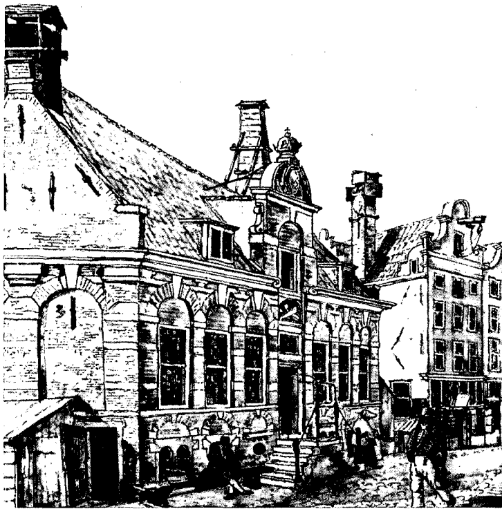
Voorgevel van het Korenmeetershuisje naar een tekening van G. Lamberts uit 1816. (foto Gemeente Archief Amsterdam).

gen schepsel die door de gilde was aangeschaft. Een schepsel was een soort houten ton, waarin het graan werd geschept en vervolgens afgestreken met een strijker of strekel tot de juiste maat. Deze voorwerpen zijn nog te zien op het reliëf boven de deur van het Korenmeetershuis van 1620.