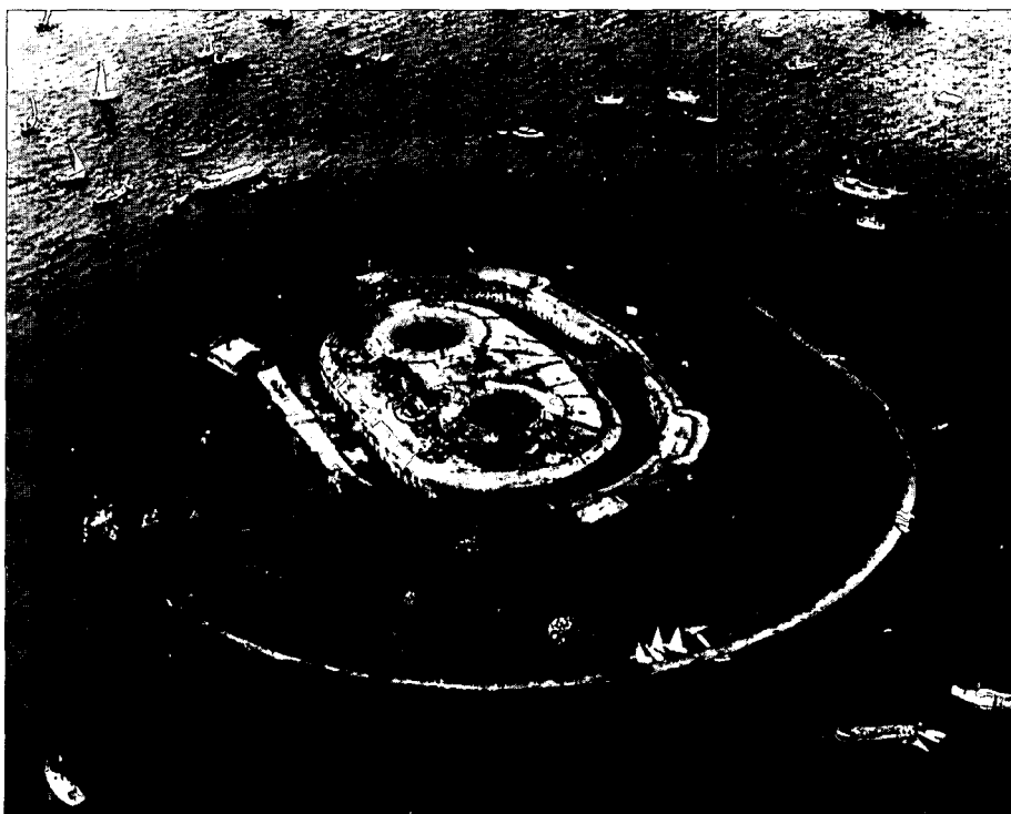
Het eiland 'Pampus'.

Het eiland beantwoordt dan ook niet aan het fantasiebeeld dat velen de afgelopen tijd van een zeefort hebben gekregen. Er zijn geen televisiesterven die er in de donkere kamers en mysterieuze gangen op zoek zijn naar sleutels en geheime