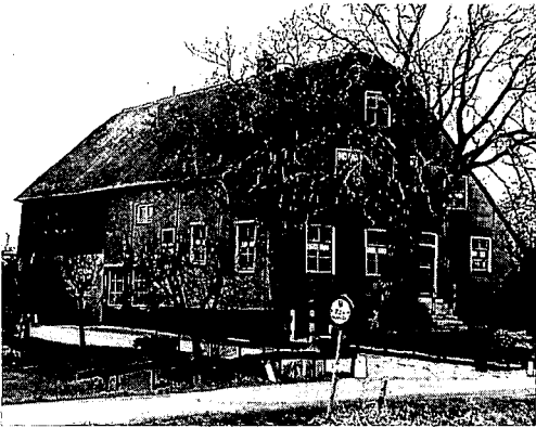
Brandwijk: 18de-eeuwse boerderij op 13de-eeuwse woonheuvel.

In Groot-Ammers floreerde de kaashandel. Men vindt daar nog een