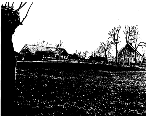
De Brandwijkse Donk: pleistocene opduiking, bewoond vanaf 4500 v.Chr.

Het gebied werd steeds overstroomd. De afzetting door de rivieren van het vruchtbare slib was de oorzaak van de welige groei van het 'elzenbroek'. Eeuw na eeuw ging dit zo door.