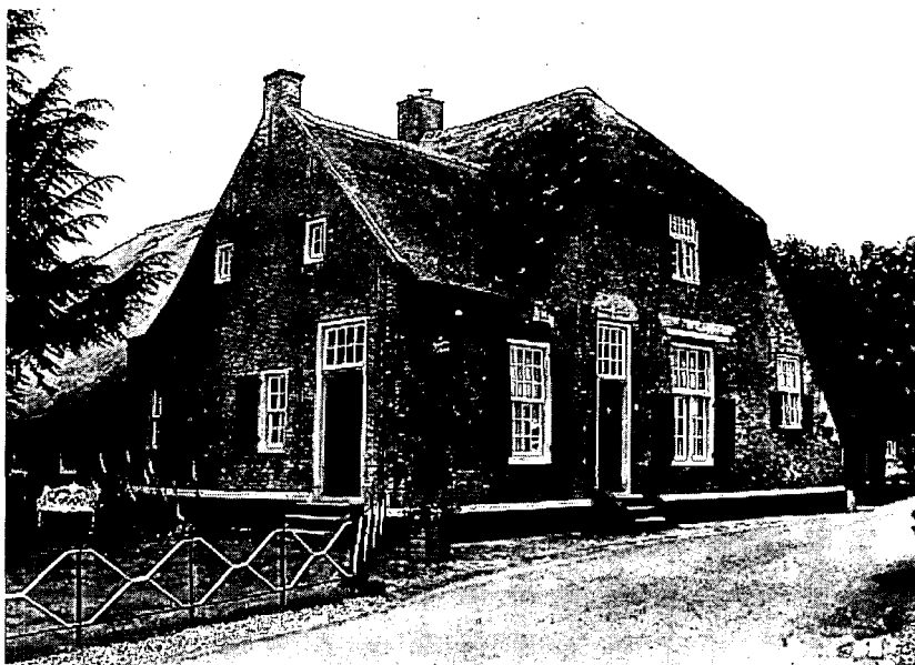
Hardinxveld-Giessendam. De Koperen Knop: 17de-eeuwse boerderij op 13de-eeuwse woonheuvel. Nu streekmuseum, gefinancierd door het bedrijfsleven.

Er zijn natuurlijk in de binnenwaard wel enkele gerestaureerde monumentale boerderijen. Een uitstekend voorbeeld hiervan is in