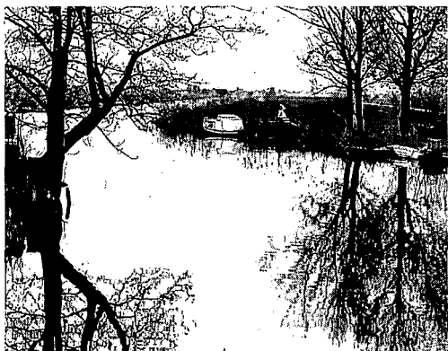
Ottoland. Boezemvliet: een van de vele vlieten, die het landschap voor de waterrecreant zo aantrekkelijk maken.

De oevers van de veenstromen waren kleiig. Men heeft hier bij de ontginning dankbaar gebruik van gemaakt door de boerderijen hierop te bouwen. Bovendien werden nog woonheuvels van klei opgeworpen. Deze woonheuvels liggen meestal nog wat hoger dan de eveneens op de oeverwallen aangelegde dijkes. Iedere polder – en dat zijn er nogal wat – had oorspronkelijk zijn eigen bedijking, kaden van toentertijd hoogstens een halve meter hoog. In 1281