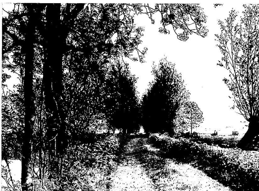
Giessenoudekerk. Tiendweg: een van de vele oorspronkelijke polderwegen, in ere gehouden na de grote ruilverkaveling.

Al die polders wateren af via weteringen, vlieten, boezems naar Elshout bij Kinderdijk, het laagste punt van de Alblasserwaard. Daar staat het oude