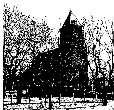
Giessenoudekerk. Ned. Herv. Kerk: een van de ruim twintig kerken en torens in de Alblasserwaard met romaanse en/of gotische kenmerken.

Politiek zijn monumenten niet belangrijk, dus het zijn stiefkinderen. Er is één gemeente waar wel een monumentencommissie is, maar die be-