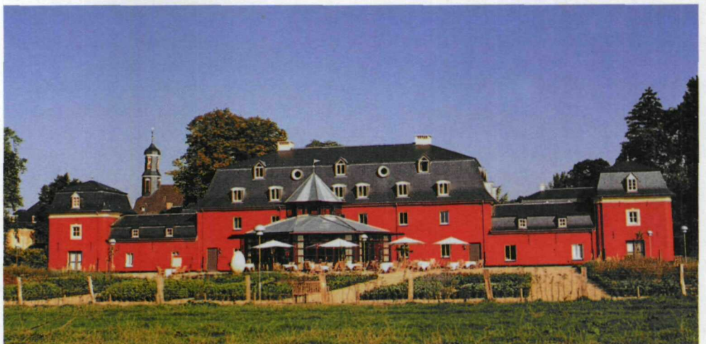
Nieuwbouw van hotel-appartementen, gebaseerd op de vormen van de voormalige schuren.