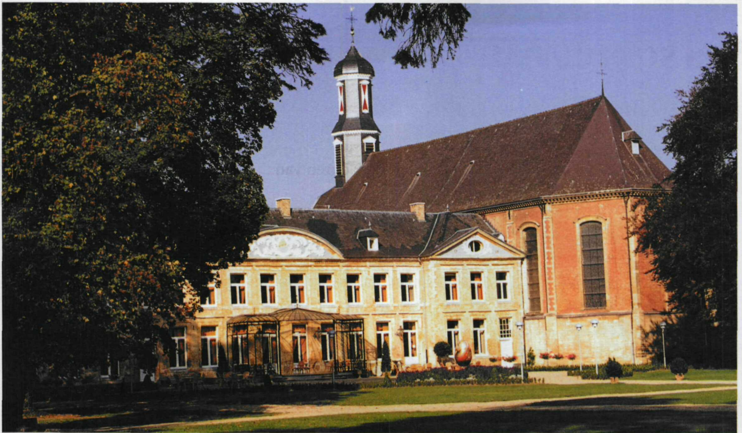
Tussen kerk en chateau ligt een extra ingang. Hier worden de pelgrims ontvangen.

constructie van glas en staal werd goedgekeurd. De meningen erover zullen nog steeds verdeeld zijn.