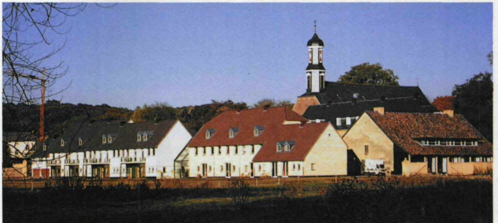
De achterzijde van de pachthof. Gekleurd met "ossebloed". In het midden de omstreden oranjerie.