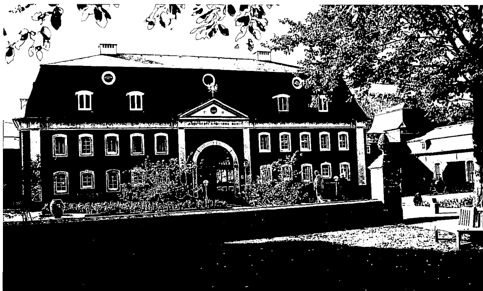
Voorzijde van de pachthof. De imitatiepoort is vervangen door de ingang van het hotel.