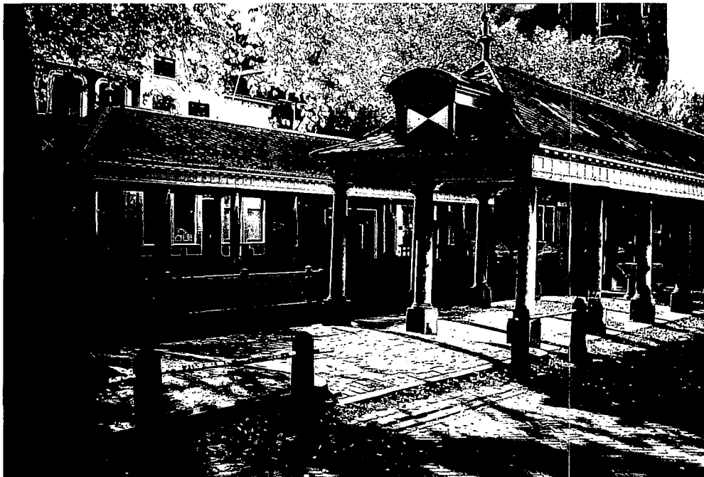
De twee visbanken aan de Gouwe te Gouda.

In bijna vijftien Nederlandse stadjes en steden vind je ze nog: de visbanken. Het zijn de overkapte toonbanken op de straat of het plein, waarop in vroeger dagen de vis werd schoongemaakt en aan de man gebracht. Op veel plaatsen zijn deze monumentale marktkramen verdwenen en herinneren alleen straatnamen nog aan hun bestaan. Wanneer ze er nog zijn vormen ze ontegenzeggelijk een verrijking van het stadsbeeld.