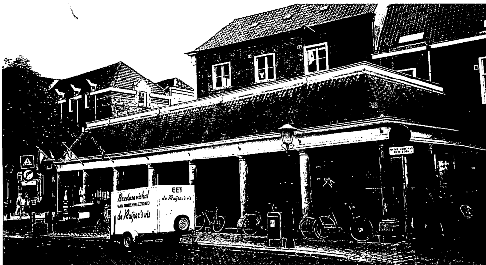
Visbank van Breda, nog steeds min of meer in gebruik als visbank.

Verder kent men visbanken in Breda (De Vismarkt aan de Vismarktstraat); Heusden (een open galerij met zijvleugels gebouwd in 1796) en in het Gelderse Culemborg (classicistisch afslaggebouwtje uit 1787). In Zaltbommel vinden we stenen visbanken in een open zuilen-