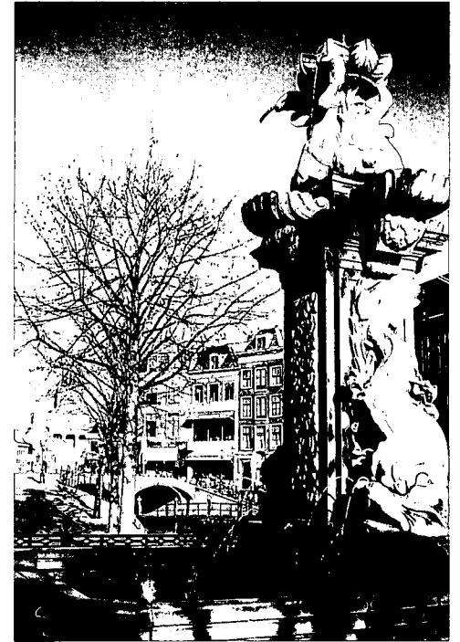
De fraai versierde fontein op de Vismarkt in Leiden.

Hergebruik van de nog resterende visbanken komt voor, maar is altijd zo gemakkelijk. Zo herbergt de Haarlemse vishal een expositieruimte en in de visbanken van Vlaardingen is een bloemenzaak gevestigd. De vishallen van