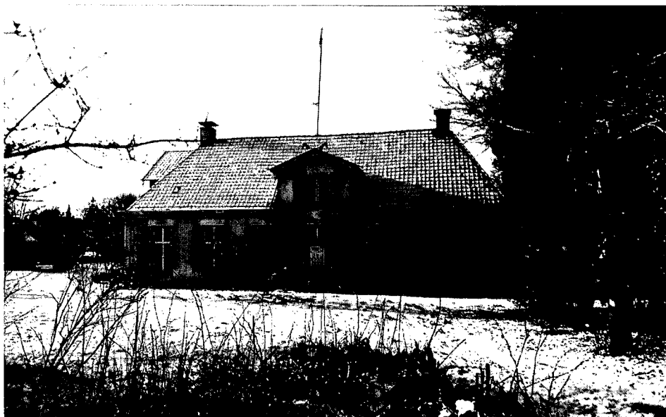
Oostgevel van het westelijke schathuis dat in het begin van de 19e eeuw verbouwd werd tot landhuis.