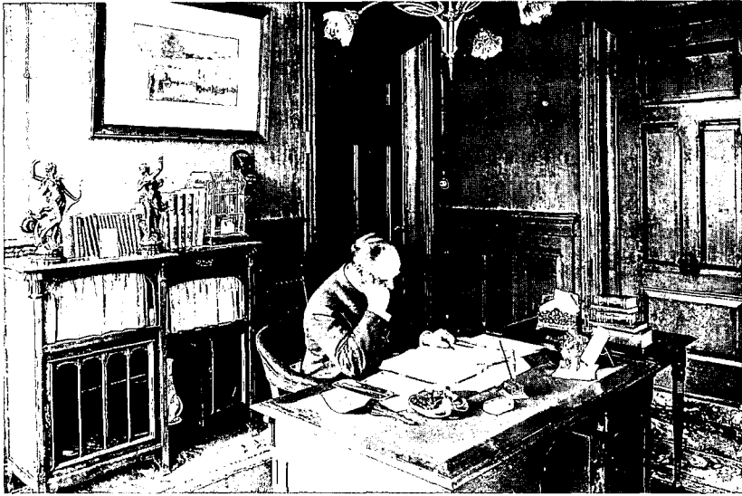
Directiekamer van het Nieuwsblad van het Noorden.

vloeden raden. Of deze, veel losser geschilderde en sterk geabstraheerde tableaus met hun motief van wortelstronken ook naar Bachs ontwerp zijn gemaakt, blijkt niet uit het merk. Het voor een deel ernstig beschadigde tegelfries in dit depot werd op kosten van de NS onlangs zeer zorgvuldig los gezaagd. Gezien de beschadigingen was het niet mogelijk om het tegel'behang' op te nemen in het in het depot geplande reisbureau. Eén deel van het tableau kreeg na restauratie een nieuw museaal leven in het Keramisch Museum Goedewaagen in Nieuw Buinen. Een ander deel is door de NS geschonken aan het Nederlands Tegelmuseum in Otterlo.