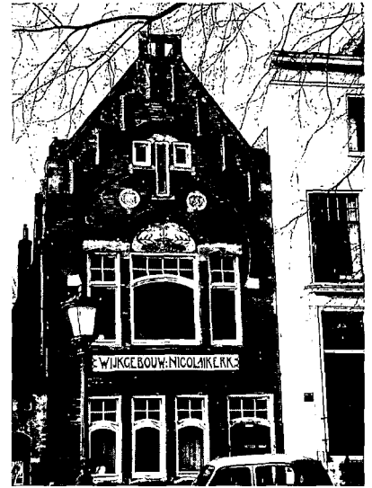
Het pand Nieuwegracht 87 met ook neo-gotische en neo-renaïssancekenmerken.

Fraai gestileerde lilies komt men onder andere tegen in het wijkgebouwtje van de Nicolaïkerk aan de Nieuwegracht nr. 87 (1901). De opdrachtgever was het bestuur van de wijkvereniging 'Nicolaïkerk'. Bij dit pand is goed te zien hoe de overgang van voorgaande stijlen ('historische stijlen' of neostijlen) naar