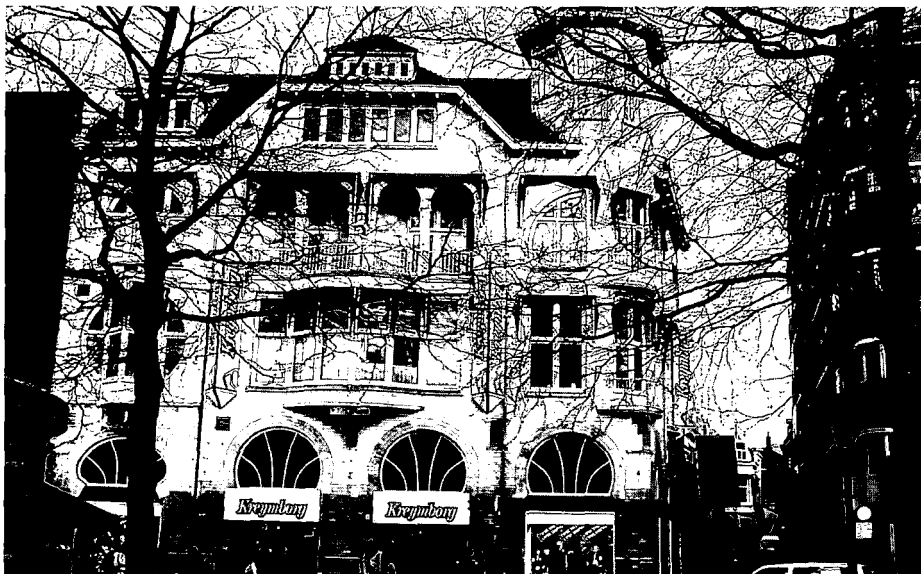
Het pand Vredenburg 3 van architect R. Rijkse.

Als we de Jugendstilarchitectuur van Utrecht vergelijken met die van met name Rotterdam en Den Haag, zien we dat de Utrechtse Jugendstil niet van een vergelijkbaar hoog niveau is. In Utrecht waren geen architecten van naam werkzaam. Het waren vooral de plaatselijke bouwkundigen die actief waren. Hun producten missen de internationale allure, maar