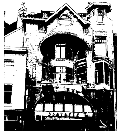
Het pand Voorstraat 6 van architect R. Rijksen.

Op dit moment is er sprake van een herwaardering van de Jugendstil