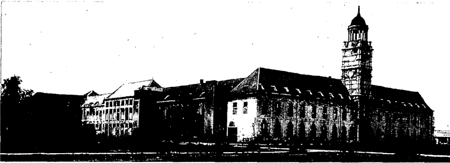
De St. Bernardasabdij in Hemiksem.

in extra hoge uitgaven op de langere termijn, een ervaring die blijkbaar iedere keer opnieuw moet worden opgedaan, en niet alleen in België.