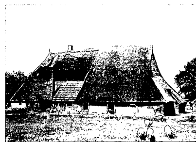
Het Veldhuis in De Huurne. Foto uit 1964.

Een ernstige verarming van Wierdens buitengebied betekende de afbraak in