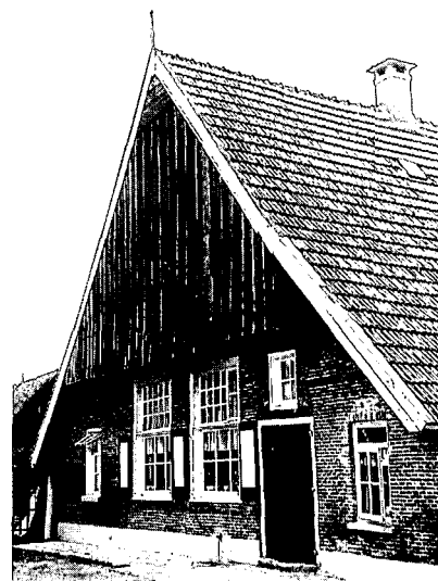
Voorgevel van de boerderij Werfstraat 12 te Enter. Afgebroken begin 1992. Foto uit 1963

Of dat ook het geval was met het huis aan de Werfstraat in Enter, valt nog te bezien. Trouwens, er is al niets meer te 'bezien' want begin 1992 werd dit Rijksmonument afgebroken nadat al veel eerder een sloopvergunning was