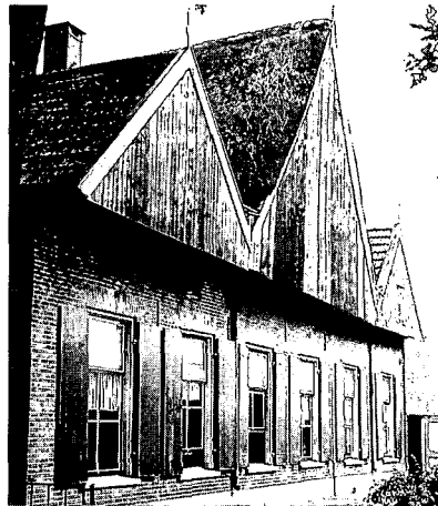
Drie topgevels van boerderij Groot Langeler in Ypelo. Foto uit 1963.

Natuurlijk is er wel meer oud cultuurgoed bedreigd. We wijzen op de zeer vervallen theekoepel van Ter Horst bij de boerderij Winkel, dichtbij de Grimberg gelegen. Rondkijkend in de Wierdense buurtschappen zouden veel boerderijen zijn aan te wijzen. Zo'n boerderij is bijvoorbeeld Beverdam , aan de Nieuwe Graven tegen de grens met Almelo. De bedreiging is duidelijk: dichtbij is een nieuw huis gebouwd en het oude staat leeg, per decreet bestemd om te worden afgebroken. Hiermee gaat niet alleen een eenvoudig, stijlvol en karakteristiek landschapselement verloren maar in