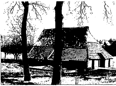
Klein boerenhuis aan de Enterweg in de Kippershoek. Foto uit 1991.