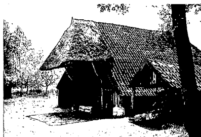
Houten schuur met overstek op het erve Schutte aan de Grimbergerweg in Notter.

lijst zou, gezien het bovenstaande, eerder reden moeten zijn tot extra oplettendheid-met-argusogen dan tot geruststelling. We verwijzen slechts naar een zinsnede in Heemschut 1992 nr. 1, gesteld door H.A. Kok in zijn artikel over de Alblasserwaard 1 : 'Veel boerderijen staan op de Rijksmonumentenlijst en zijn daardoor enigszins beschermd'. Maar ook niet méér dan dat. De procedure is eenvoudig: het gebouw verwaarlozen dan wel de omgeving ontluisteren door oneigenlijk gebruik of onaangepaste moderne nieuwbouw. Dan 'staat' het oude ge-