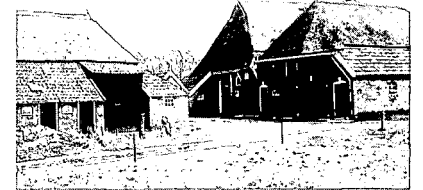
Complex huis met schuren van het erve Peters. Foto uit 1978.

De ernstigste bedreiging, die zich momenteel op Wierdens boerderijland voordoet, is die rond het erve Peters , Ypeloweg nr. 14 onder Ypelo. Komend vanaf de Rijssensestraat en na een vrij groot boscomplex ligt rechts de boerderij Barfde (Barvoorde), ooit gebouwd uit afbraak-materiaal van een nabijgelegen kasteeltje. Dit gave, fraaie huis is gelukkig bij de tegenwoordige bewoners in goede handen. Links, aan de andere kant van de weg, ligt Peters, een boomrijk erf met een complex gebouwen dat alle kenmerken draagt van 19de/20ste-eeuwse aanpassingen en verbouwingen in