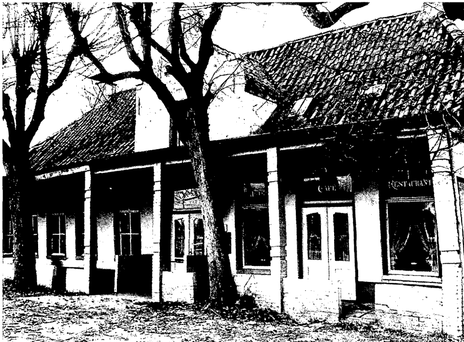
De huidige toestand van het pand

De Stichting 'Het Woonhuismonument' is erin geslaagd om in enkele maanden tijd een haalbaar plan op tafel te leggen voor het behoud van de voormalige herberg 'Onder de linden', beter bekend als Café Siegers, te Aduard. Ze heeft een serieuze gegadigde gevonden voor dit pand, dat op de nominatie staat om gesloopt te worden. De Stichting ziet concrete mogelijkheden om een restauratie te financieren.