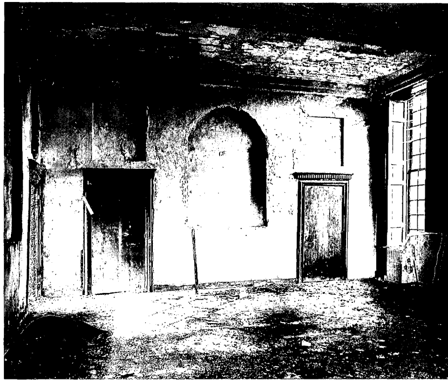
Hal, noordwand met nissen. Foto H. Schouten 1989

ment de opdracht een adviesrapport over Heemstede te vervaardigen. De conclusie van het rapport is dat zowel het huis als de tuinen 'van internationale betekenis' zijn en de gehele buitenplaats tot de top vier van de Nederlandse Buitenplaatsen met een Formele aanleg behoort. Nieuwbouw op het terrein is derhalve volstrekt ongewenst. Ook laten zij op het terrein weerstandsmetingen door de Stichting R.A.A.P. uit Amsterdam verrichten. De eerste resultaten zijn bemoedigend en laten de funderingen van bassin en enkele paden van het sterrebos zien. Deze gege-