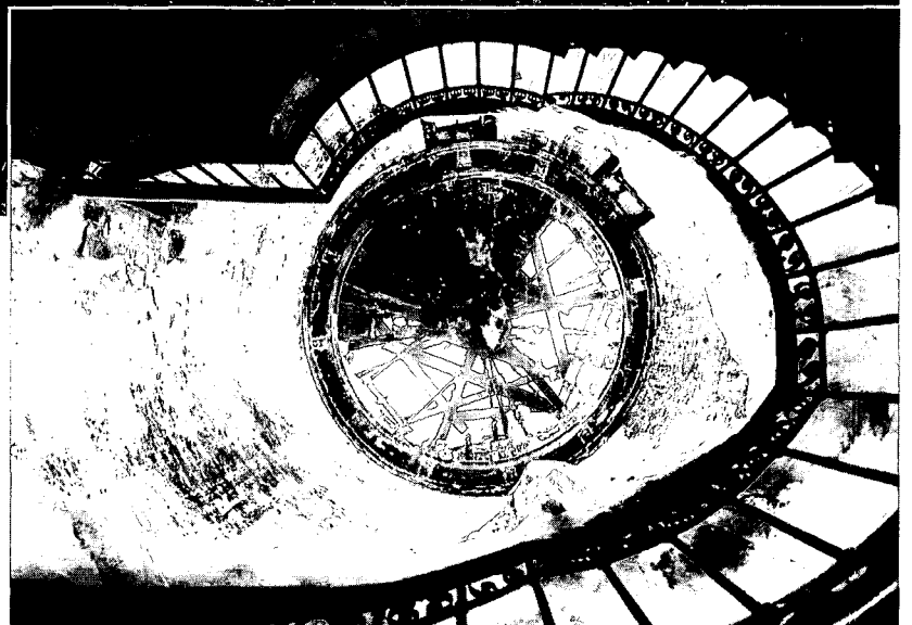
Trappenhuis, met trap en ingestort koepelgewelf. Foto H. Schouten 1989.

En dan, op zaterdag 10 januari 1987, staat ineens het huis in brand. Wanneer de brand om 9.00 uur gemeld wordt, is er slechts sprake van een kleine uit-slaande brand in de grote zaal. De sterke oostenwind en het slechts korte brandweeroptreden in huis (de brandweerlieden werden spoedig het huis uitgewezen) zorgden ervoor dat het kurkdroge huis vrijwel volledig uit-brandde. Tot overmaat van ramp besluit men de enorme centrale schoorsteen om te duwen naar de achterzijde van het huis. Hierdoor wordt niet alleen de schoorsteen met zijn smeedijzeren bekroning volledig verwoest, maar ook de achtergevel met het bijzondere balconhek van 1682. Het gevolg is dat de stijfheid uit het casco is verdwenen