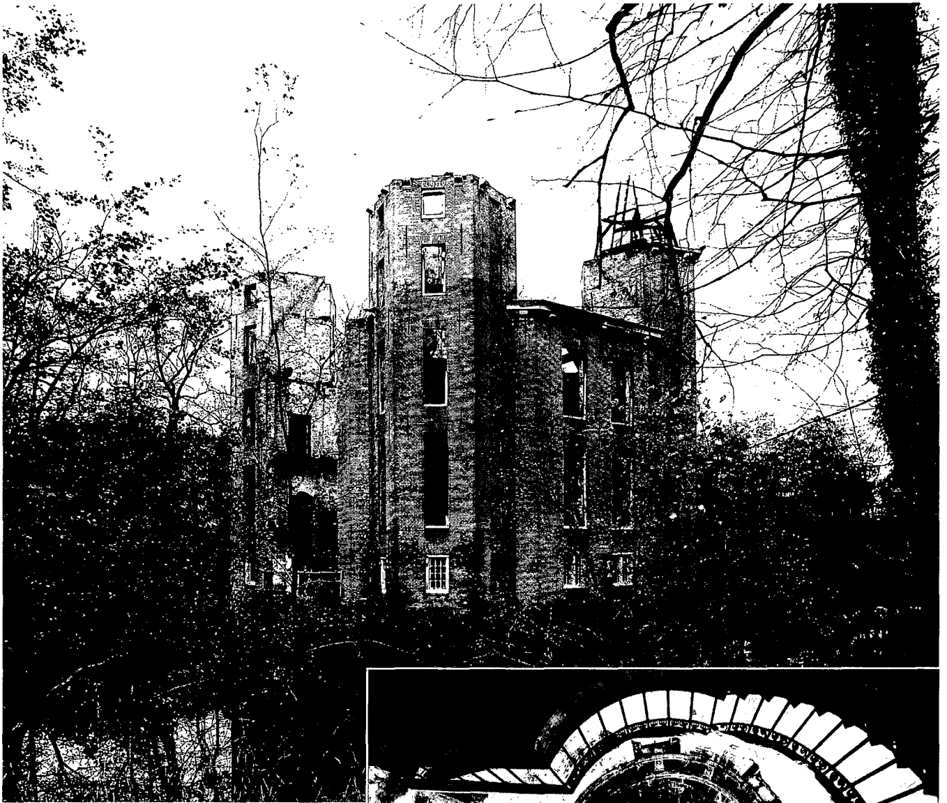
Heemstede, gezien vanuit het zuid-westen. Foto H. Schouten 1989.

lijk voor anderen plannen ontwikkelt en zelden zelf terreinen aankoopt. Immanagement ziet wel mogelijkheden voor het ontwikkelen van een congrescentrum met hotelaccommodatie mede gezien de ligging ten opzichte van de nieuwe autosnelweg A27.