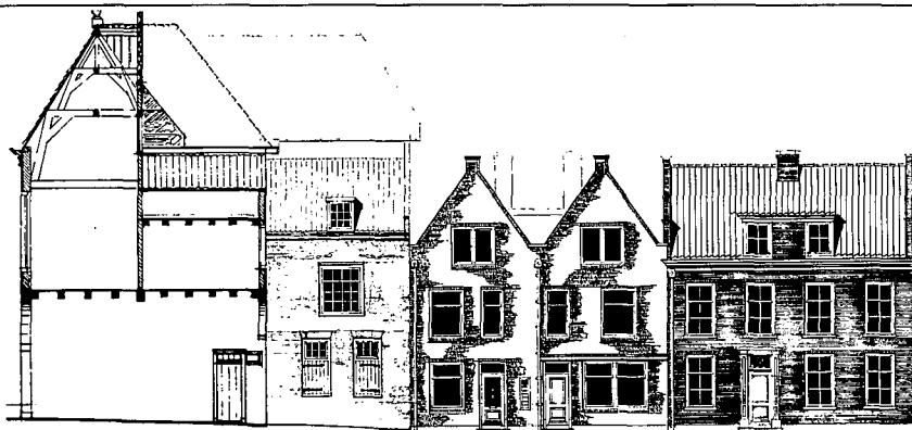
doorsnede Waag 1650