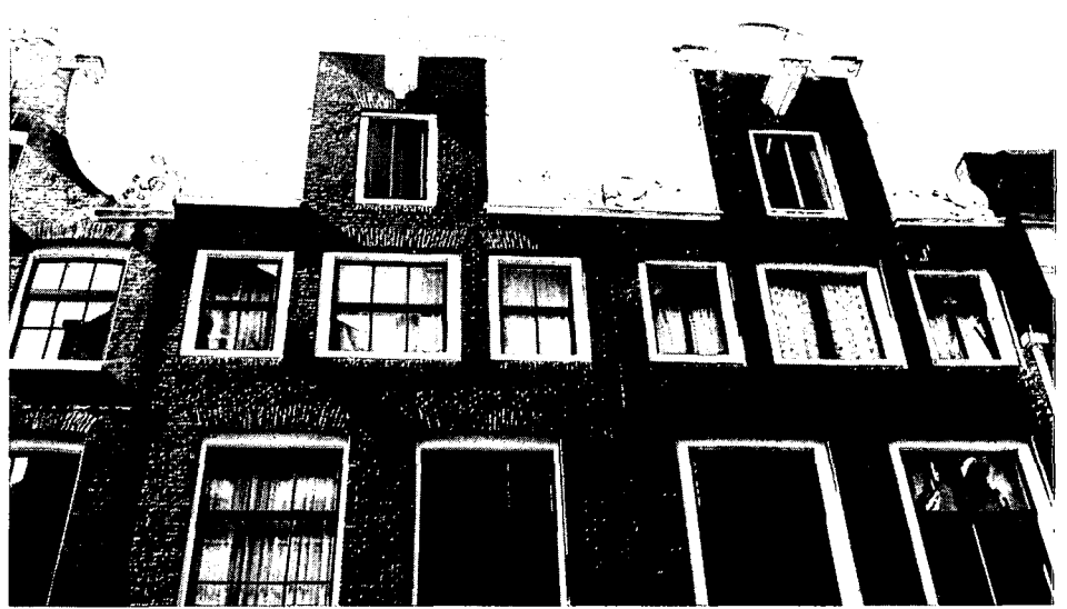
Twee foto's van de Lange Leidsedwardsstraat te Amsterdam vóór en na de restauratie. Bij de restauratie van nr 146 werd besloten de tweeling nrs 144-146 te herstellen door de latere top en gevelindeling terug te brengen in overeenstemming met buurman nr 144. Verantwoord herstel om tot een aaneengesloten gave gevelwand te komen. Zie pag. 13

perioden, kan het uit verschillende historische betekenislagen opgebouwde beeld van het monument vervalsen door er een statisch, historisch ongedifferentieerd beeld voor in de plaats te stellen: een monument als een perfecte maquette, maar met een gereduceerde geschiedenis. Een monument is niet alleen een architectonische schepping, maar ook drager van de overblijfselen van de geschiedenis der bewoning, van het gebruik, van de smaak of meer in het algemeen van een cultuur.