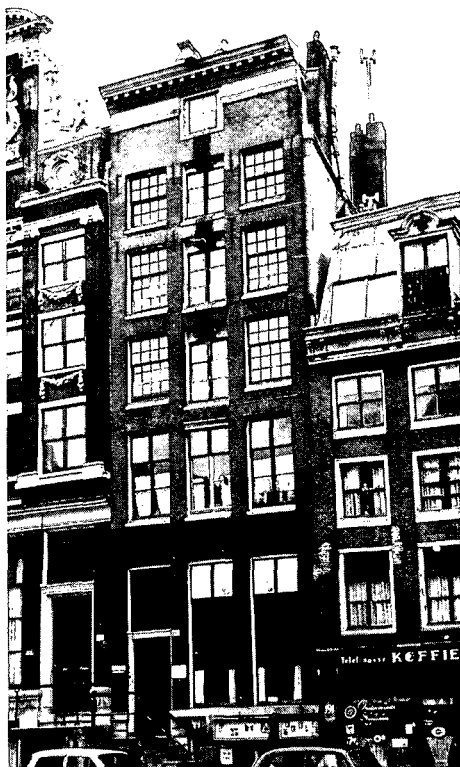
Bij Oudezijds Voorburgwal 189 in de hoofdstad is er geen doorslaggevende reden om de aangebrachte lijstgevel bij de (komende?) restauratie niet te handhaven.

6. Op het verwijt dat de Rijksdienst aanvragers van vergunningen ex artikel 14 en van subsidies te lang in het ongewisse laat, kan geantwoord worden, dat de administratie van de dienst binnenkort geautomatiseerd wordt, zodat te verwachten is dat ongewenste vertragingen niet meer zullen kunnen optreden.