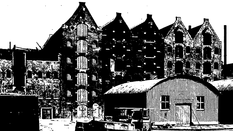
Prinseneiland 75, Amsterdam, verantwoorde reconstructie. De bebouwing van het Prinseneiland bestaat voor een groot deel uit monumentale pakhuizen, alle uit dezelfde periode, een stedenbouwkundige context die deze reconstructie 'dicteert'.

van een subsidie-regeling, door een strenge toepassing van de wetsartikelen die aantasting van beschermde monumenten verbieden en door te lagere overheden te activeren tot een eigen beleid op dit gebied.