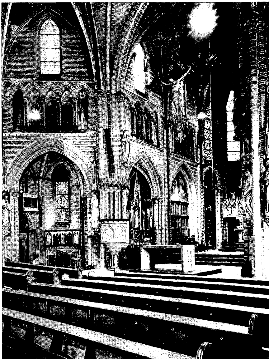
INTERIEUR VAN DE VONDELKERK