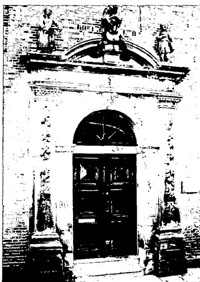
Weeshuispoortje voor de restauratie.

deeld op hun stedenbouwkundige kwaliteit.