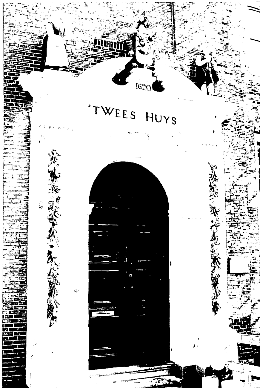
Weeshuispoortje na de restauratie.

De heer Zantkuyl: 'Restaureren is altijd een tijdgebonden aangelegenheid. Je kan dat nooit objectief benaderen. Dat die poortjes aan het begin van onze eeuw van hun verflagen werden ontdaan had te maken met de toenmalige visie op restauratie. Er valt niets te verwijten, men had immers het beste met de poortjes voor. Bij ons speelt een andere overweging een rol. Het stadsbeeld van Hoorn had een stevige oppepper nodig en wij hebben de poortjes vooral beoor-