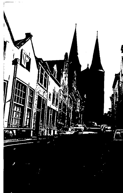
Auto’s in het Bergkwartier.