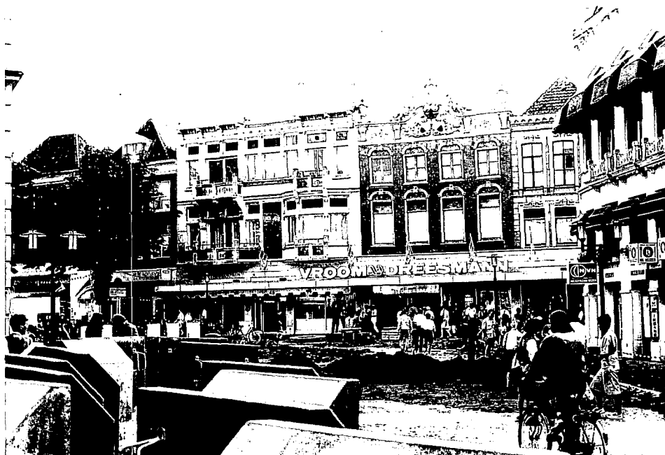
Reconstructiewerkzaamheden op de Brink