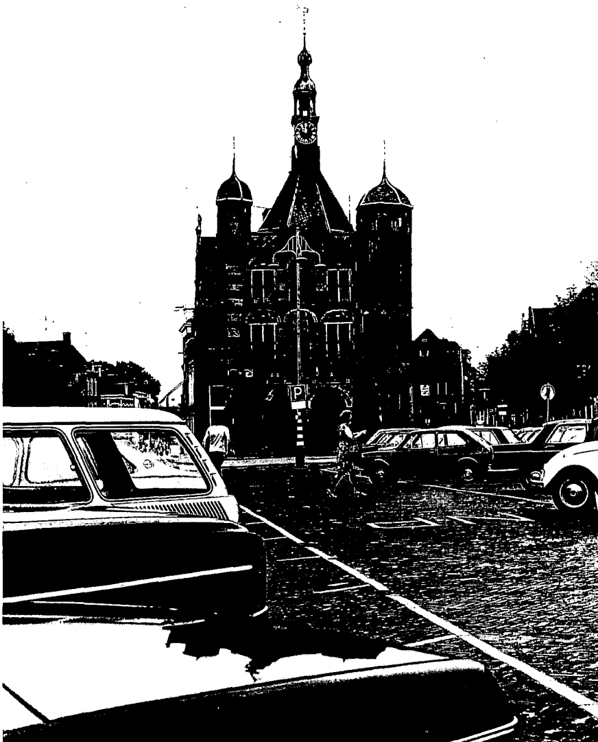
Brink met de Waag vóór de herinrichting. Autoblik bedierf het ruime plein. Nu is de auto verbannen (zie foto op pag. 9).

Het beleidsplan komt nogal verreikend over. Hans Magdelijns benadrukt dat wie niet waagt zelden wint. Bovendien is ook de plaatselijke politiek gebaat bij een zo volledig mogelijke presentatie van knelpunten, verlangens en voornemens. Uiteindelijk bepaalt de gemeenteraad dan welke dromen er waargemaakt kunnen