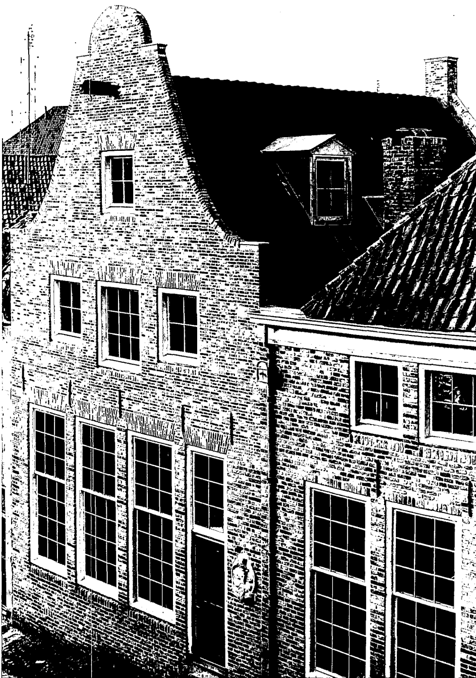
Eerste voltooid huizen in het Bergkwartier

het gesprek dat ik met haar en de heer Eggink had, mijn gids te zijn tijdens een wandeling door het Bergkwartier.