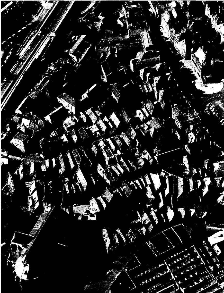
Het Bergkwartier vanuit de lucht

De NV Bergkwartier, Maatschappij tot Stadsherstel te Deventer, mag een succesvolle organisatie heten. In de kwart eeuw dat de NV bestaat, heeft ze ruim 90 panden gerestaureerd en al even lang treedt ze op als verhuurder van het door haar gerestaureerde bezit. Al die jaren is de NV bovendien in staat geweest om haar aandeelhouders het maximale percentage dividend uit te keren.