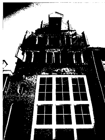
Gerestaureerd pand in de Walstraat

Hoewel in het bezit van meerdere panden, heeft de heer Strik zich nog nooit opgeworpen als een speculant. 'Handel drijven met panden heb ik nooit gedaan. Ik heb zelfs nog nooit een pand verkocht. Het is me altijd uitsluitend te doen geweest om het