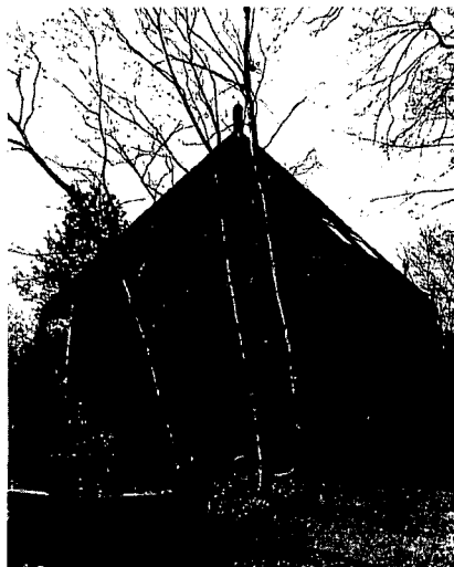
Driehuizerkerkweg 4. Woonhuis van W. van Heyst uit 1921.

Geen officiële bouwopdrachten maar verzoeken om een 'ontwerpschetsje' waren het waarmee vrienden en