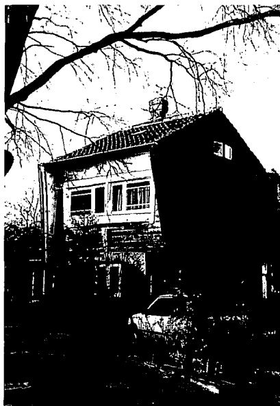
'De Huif' aan Driehuizerkerkweg 12 uit 1922 (foto M. Polman, 1993).

De typische Amsterdamse Schoolkenmerken zoals die in De Huif zijn toegepast, bijzondere kapvorm, beschot op de verdieping, sierhout en variatie in roede-verdeling en deurprofilering zijn ook kenmerkend voor het woonhuis Driehuizerkerkweg 4 dat Bartels in 1921 ontwierp voor W.