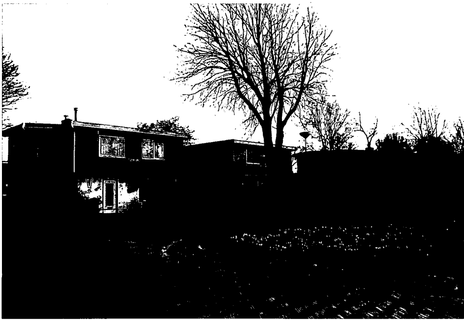
Driehuizerkerkweg 57-59. Woonhuizen uit 1922 (foto M. Polman, 1993).

als een zuivere representant van de Amsterdamse School. Immers juist het idee van totaalconceptie, het bouwkundig plan integreren in gerelateerde disciplines als meubel- en interieurontwerp, schilder- en beeldhouwkunst, vormde daarin een essentieel onderdeel. De architectonische activiteiten van Bartels bleven niet beperkt tot Driehuis. In Velsen Zuid, IJmuiden. Bloemendaal, Heemstede en Overveen verzezen woonhuizen naar zijn ontwerp. Maar ook van de karakteristieke muziektent in het park Velserbeek is hij de geestelijke vader.