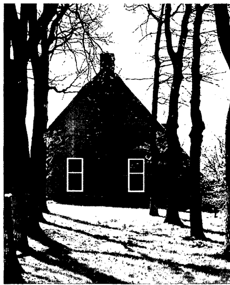
Natuur en cultuur harmoniëren hier op fraaie wijze. Het voorerf van een boerderij in Zuidvelde (gem. Norg) gaat hier over in de aangrenzende brink met bomen.