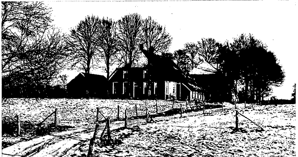
Boerderij op de rand van het Reestdal. Linden vóór de woning, eiken op het achtererf. Eigendom van de Stichting 'Het Drentse Landschap'.

'Drenthe in verandering behoeft ons niet te verontrusten', was de geruststellende conclusie van landschapsarchitect ing. G. H. Hollema aan het slot van zijn lezing over 'De kwaliteit van het Drentse landschap'. 'We bevinden ons in een intensieve samenleving, waarin ook het landschap zijn nadrukkelijke rol speelt. Het landschap is nooit een statisch gegeven geweest, wat ook weer reden is om op te passen voor behoudzuchtige maatregelen op die plaatsen waar hiervoor geen aanleiding is', waarschuwde Hollema. 'Een positieve instelling als het gaat om