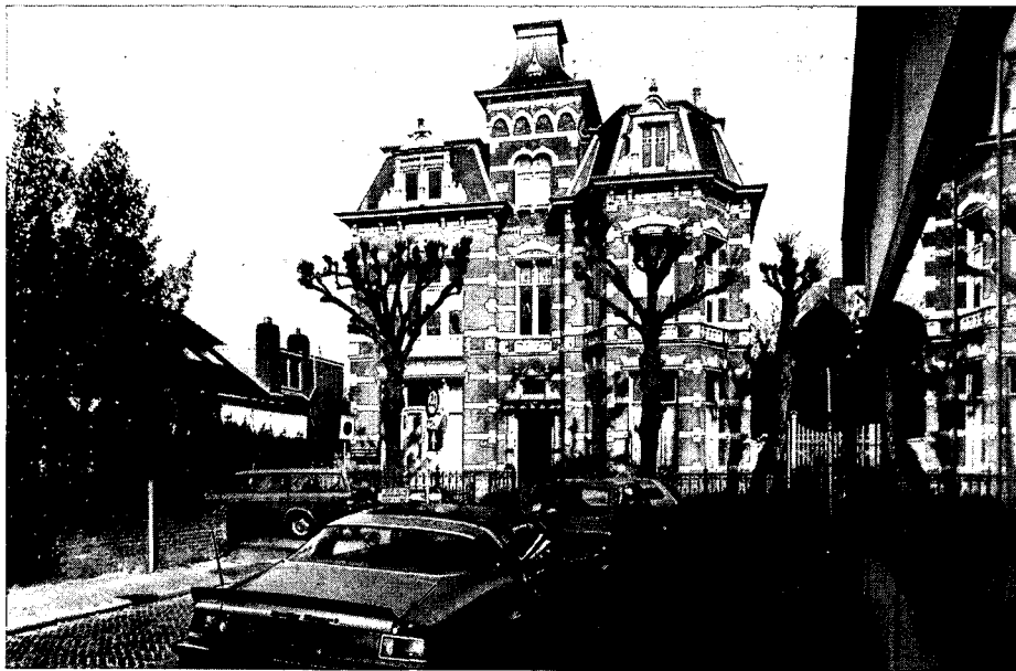
Villa aan het Zuideinde in Meppel, voorbeeld van het eclecticisme