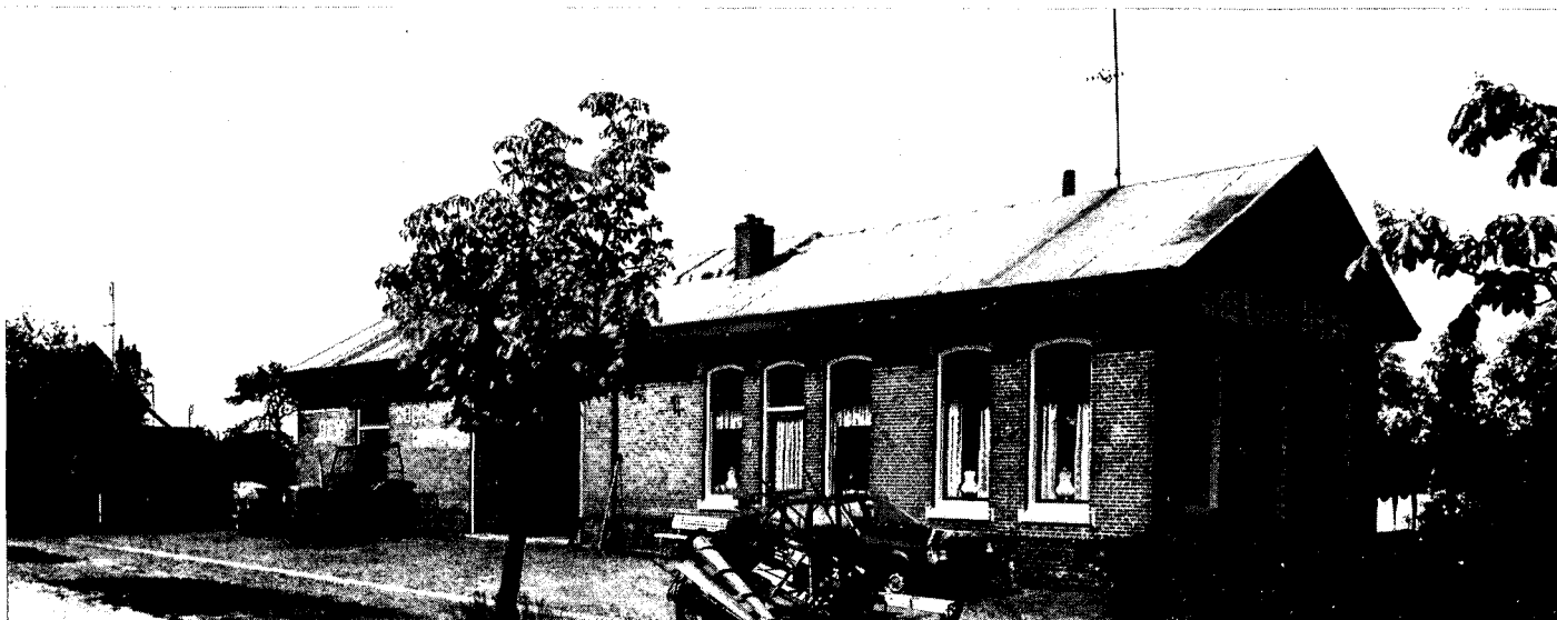
In de laatste decennia van de vorige eeuw werden in Drenthe veel tramwegen en lokale spoorwegen aangelegd. Het station Hijkersmilde aan de tramlijn Meppel-Assen volgde in het eerste kwart van deze eeuw

geveer 54.000 in 1945. 'Van die 54.000 zijn als gevolg van saneringen in de jaren zestig en zeventig naar schatting 8000 verdwenen', licht de project-coördinator verder toe, 'zodat er nog ongeveer 34.000 overblijven die in het kader van het MIP in meer of mindere mate bekeken moeten worden.' Uiteraard gaat het bij het MIP-onderzoek om meer dan enkel woningen.