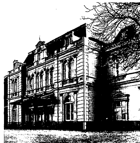
Pleistergevels kent Arnhem in alle soorten en maten. Men is er zo aan gewend, dat men ze pas mist als het te laat is zoals hier het geval is met het hotel van de Vogel- en Plantentuin aan de Velperweg.

Ook voor de minder bekende woonhuismonumenten – een tot nu toe vrijwel vergeten groep – fronsen de ingewijden hun wenkbrauwen. Kortom, er was veel te doen, er is volop werk en dat zal voorlopig wel zo blijven. Veel illusies over een grootschalige aanpak hoeft men zich met de huidige financiële vooruitzichten ook niet te maken. De kunst zal zijn om een gulden