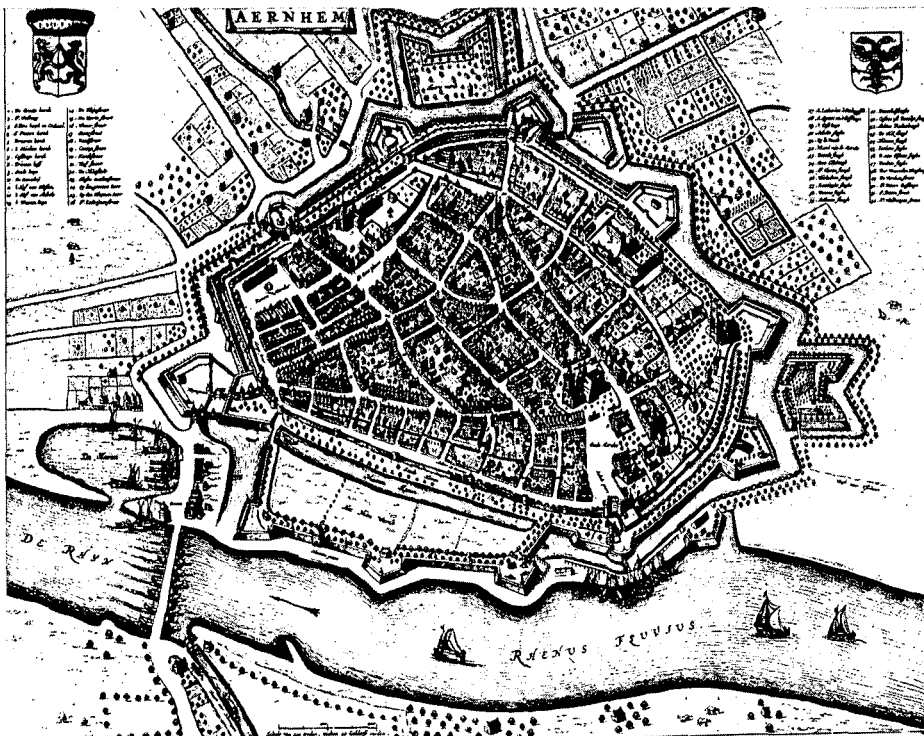
Arnhem's oude stadshart in vogelvlucht naar een plattegrond van J. Blaeu uit 1649.

Te veel wordt opgeofferd, zonder werkelijke discussie. Zo verliest Arnhem zonder slag of stoot door economische pressie en politieke hazenlegerij binnenkort het door ir. J.H. Oosterhuis in 1938 gebouwde hoofdkantoor van de Provinciale Gelderse Electriciteits Maatschappij, een gaaf en kerngezond voorbeeld van 'nieuwe zekerheid', dat kan wedijveren met Dudoks schepping (voormalig kantoor van de Verzekeringsmij 1845) aan het Willemsplein. En daarbij blijft het niet. De laatste, verpauperde herenhuizen aan de Rijn (Utrechtseweg), wil men prijsgeven voor projectontwikkeling. Aan de Velperweg