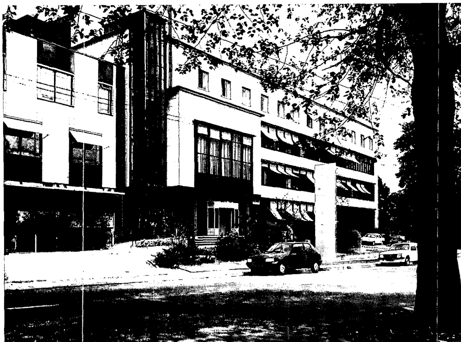
Het kantoorgebouw van de P.G.E.M. aan de Utrechtseweg, een perfecte, helaas te klein geworden creatie van ir. J. H. Oosterhuis uit 1938/39. Nauwelijks gewogen, a priori te licht bevonden.

staat een van de laatste kapitale villa's, de voormalige garage L.A. Moll, willens en wetens te verkommeren. Sloop is het enige wat men tot op heden kon bedenken. Het creatief vermogen reikt niet verder dan het realiseren van een nieuw – waarschijnlijk jaren leegstaand – kantoorpand. Wees toch in hemelsnaam zuinig op wat nog is!