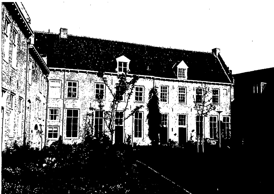
Westvleugel Agnietenhof na de restauratie

ramen, zodat er in feite vides zijn ontstaan. De tussenvloeren en muren zijn uitgevoerd in sobere eenvoudige constructies. Liftschacht en trappen zijn van staal en geven een 'lichte' indruk. Bijzonder is de verbinding aan de hofzijde tussen de buitenmuur en de inbouwmuren en -vloeren. Deze verbinding wordt gevormd door smalle glazen stroken. Staat men aan de gevel, dan kan men via deze openingen, ondanks de verdeling in ruimten, de hele oorspronkelijke gevel in ogenschouw nemen. Dit geeft enigszins een indruk van de hoogte en diepte van de oorspronkelijke refter. Het Gelders Oudheidkundig Contact heeft met deze nieuwe behuizing de gewenste ruimte gekregen en kapel en refter een passende bestemming.