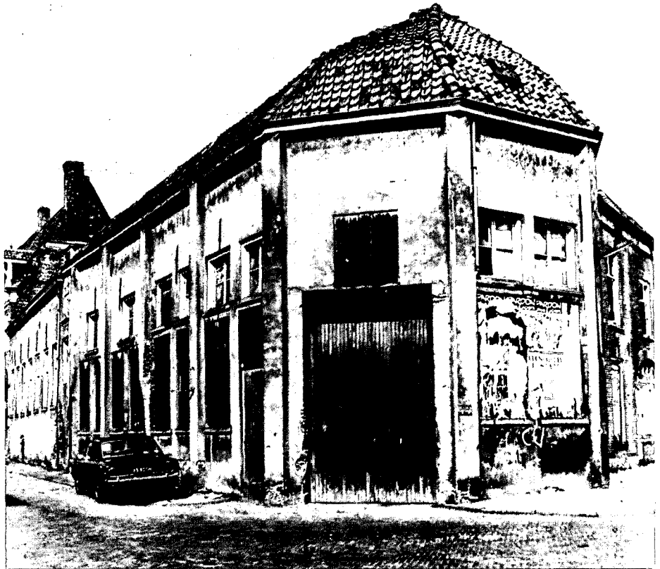
Kapel van de Agnietenhof voor de restauratie

De meeste woningen werden voor een bedrag van totaal ca 300.000 gulden aangekocht. De restauratiekosten bedroegen totaal tegen de 5 miljoen. Om de restauratie mogelijk te maken werd naar nieuwe bewoners, tevens economische eigenaren, gezocht. Gelukkig werden deze snel gevonden. Op een andere manier zou zo'n