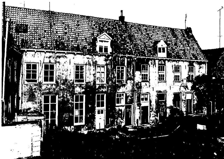
Westvleugel Agnietenhof vóór de restauratie

Gelukkig werd tijdig een nieuwe bestemming gevonden voor kapel en refter. Het Gelders Oudheidkundig Contact en Depot werd de nieuwe huurder en deze werd nauw betrokken bij de indeling van de ruimten. Naast kantoren, vergaderruimtes, depots, restauratieateliers heeft Gelders Contact een media- en diatheek. Met gebruikmaking van moderne materialen zijn kapel en refter naar behoefte ingevuld. Men zou kunnen spreken van een 'inbouwpakket', dat indien nodig weer 'uitneembaar' is. Ter plaatse van de kerkensters zijn de tussenvloeren los gehouden van de