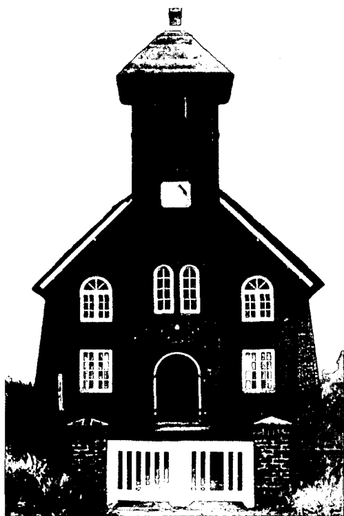
Vredeskerkje naar ontwerp van Taets van Amerongen en P. Elders (1918), gebouwd op initiatief van mevrouw van Reenen

Voordat men Bergen aan Zee binnentrijdt ziet men aan de rechterhand het Vredeskerkje , dat in 1918 in opdracht van de zeer gelovige mevrouw Van Reenen werd gebouwd. Het ontwerp is van H.L. Baron Taets van Amerongen en archi-