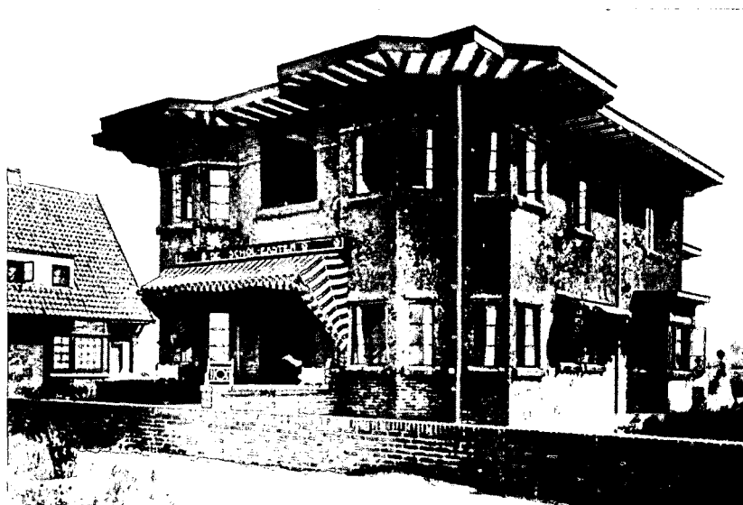
Villa 'de scholekster' aan De Boulevard uit 1919, ontworpen door De Clerq. In de oorlog afgebroken,

Bij het uitbreken van de Tweede Wereldoorlog was Bergen aan Zee uitgegroeid tot een volwaardig dorp