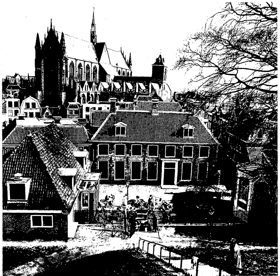
Voorgevel Heerenlogement vanaf De Burcht gezien. Linksvoor het koetshuis; daarachter aangepaste nieuwbouw t.b.v. de bibliotheek. Rechtsvoor een 18e eeuwse pand met 19e eeuwse erker, behorend bij de Burchtzalen.