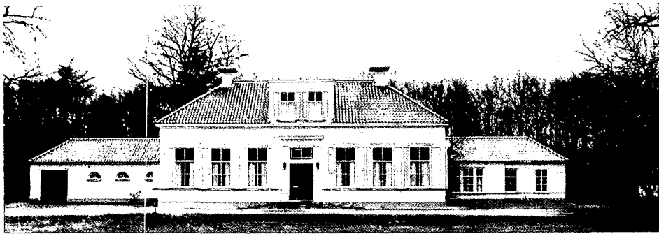
Voormalige woning van de directeur, nu pastorie

zich onder toezicht herenigen. De meest voorkomende overtredingen waren desertie en ontvreemding van goederen. De straffen varieerden van eenzame opsluiting, slechts water en brood tot lijfstraffen.