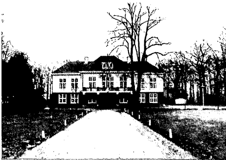
Het Verenigingsgebouw voor de ambtenaren van Veenhuizen I, II en III aan de Hoofdweg langs de Kolonievaart

spronkelijke plaats; helaas is dit (nog steeds) verboden terrein. Het aantal werkplaatsen en het aanbod van producten werd in deze eeuw opgevoerd. Veel werd er vervaardigd t.b.v. Overheidsinstanties (postzakken, uniformen, meubilair enz.), maar Veenhuizen leverde bijvoorbeeld ook meubilair aan de vooraanstaande winkel Pander.