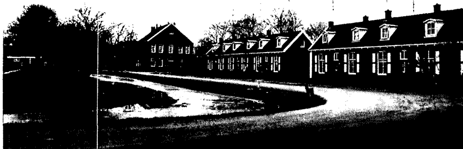
Bedsteewoningen bij Veenhuizen uit 1890, nu gerenoveerd.

Allereerst werd begonnen met het graven van een schipsloot vanuit de Norgervaart, noodzakelijk voor de toelevering van bouwmaterialen. De schipsloot kreeg later de naam Kolonievvaart. Nog in hetzelfde jaar werd begonnen met de bouw van het eerste gesticht. Er werd in een ijtempo gebouwd en in 1825 stonden er drie gestichten. Het eerste gesticht was bestemd voor wezen en vondelingen en kon, verzorgers niet meegeteld, ca 1200 verpleegden onderbrengen. Zij weefden ondermeer kleding voor eigen gebruik en later ook koffiezakken voor de export naar Indië. Het tweede en derde gesticht herbergden landlopers en bedelaars en hun gezinnen. Zij werkten in de veenderijen, op het land, in werkplaatsen en voor de huishoudelijke dienst. In de loop der jaren werden er in de nabijheid nog een twintigtal hoeven gebouwd (hierop werden zetboeren, vrije kolonisten, geplaatst), een zuivelfabriek, korenmolen, bakkerij, klompenmakerij (een fabriek op zich, want iedereen liep op klompen), timmerloods, smederij, weverij, ambtenaren- en opzienderswoningen.