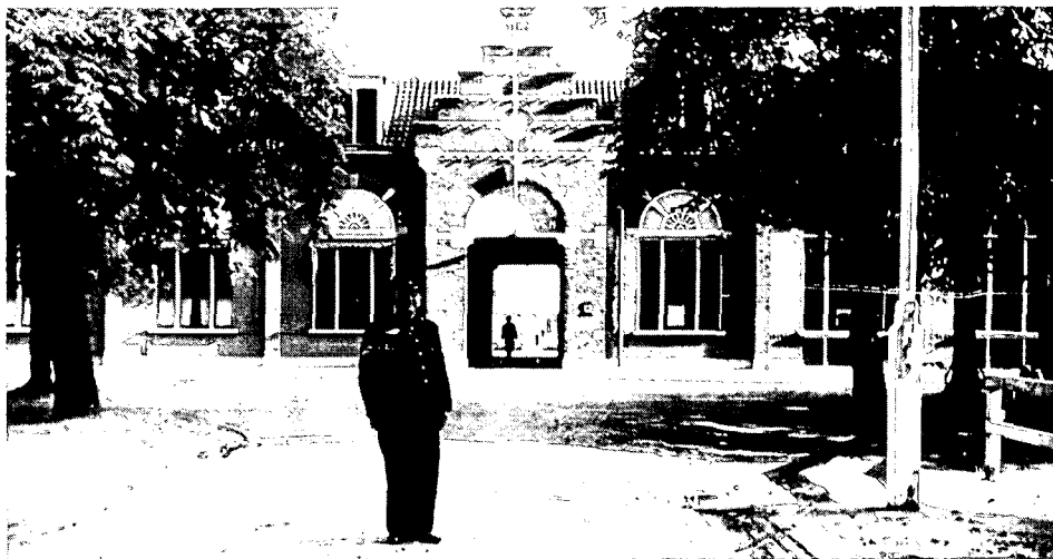
Het gesticht Norgerhaven uit 1895-1900.