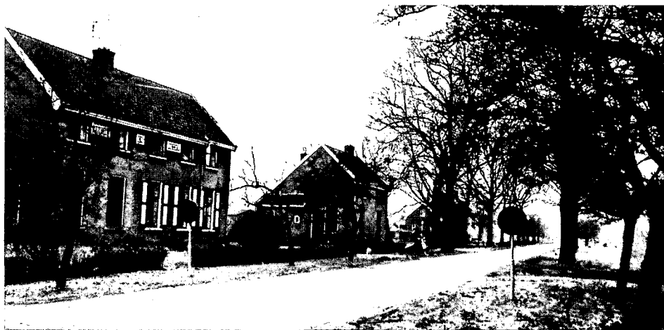
Deze woningen tegenover 'Esserheem' worden om veiligheidsredenen afgebroken

Het 'Directiehotel' of de 'Villa' aan de Kolonievvaart, waar de hoge bezoekers uit Den Haag logeerden, dateert uit 1901. Veenhuizen III werd officieel in 1911 gesloten. Het verkeerde in een bouwvallige staat en het aantal verpleegden was inmiddels ook sterk teruggelopen. In 1912 werd er een op turf gestookte elektriciteitscentrale gebouwd, die zorgde voor de aandrijving van de diverse machines in de werkplaatsen. Wat betreft de electriciteit was men er vroeg bij voor nederlandse begrippen. Met de aanleg van riolering in 1956 was men uitermate laat! De oude elektriciteitscentrale is nog aanwezig en bevindt zich gelukkig nog op de oor-