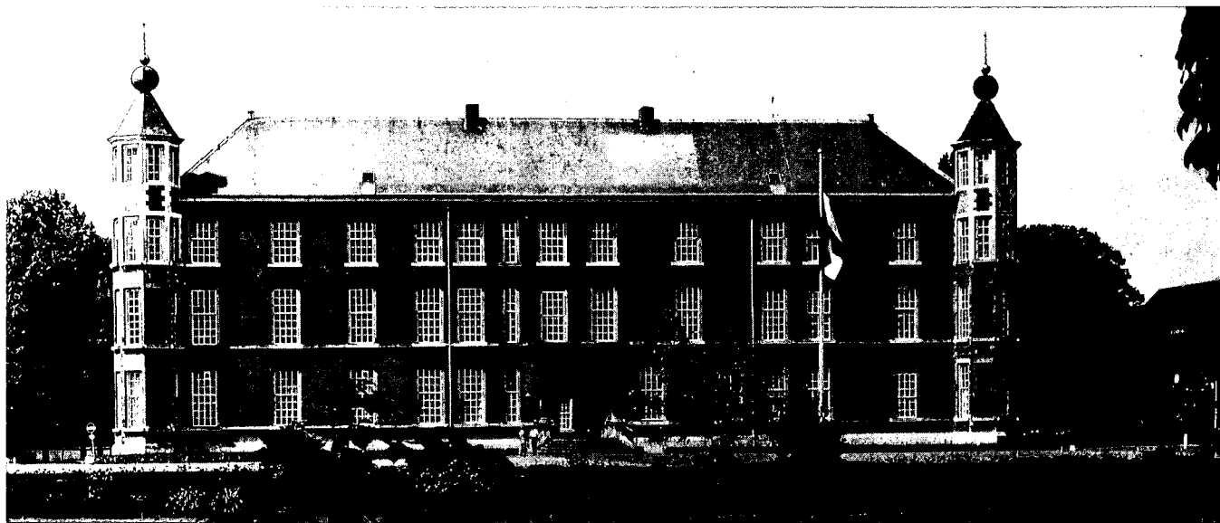
Het 'Kasteel van Breda', zoals het te zien is vanuit het stadspark Het Valkenberg. Links en rechts de in 1964 herstelde torens en in het midden de 'Henricus Poort', die toegang verleent tot de binnenplaats. De tweede verdieping is er in 1826-1829 op gezet en daarboven is weer een zadeldak geplaatst