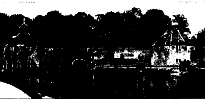
Twee waltorens van het kasteel

Bij het schrijven is gebruik gemaakt van het 'Het Kasteel van Breda en de Koninklijke Militaire Academie' – een geschiedkundig overzicht – van KMA-bibliothecaris H. J. Wolf, 1980/1984, Inrichting Uitgeven Boekwerken, Emmen, en van materiaal uit het Stadsarchief Gemeente Breda.