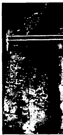
Bouwspoor van Middel-eeuwse schouw.