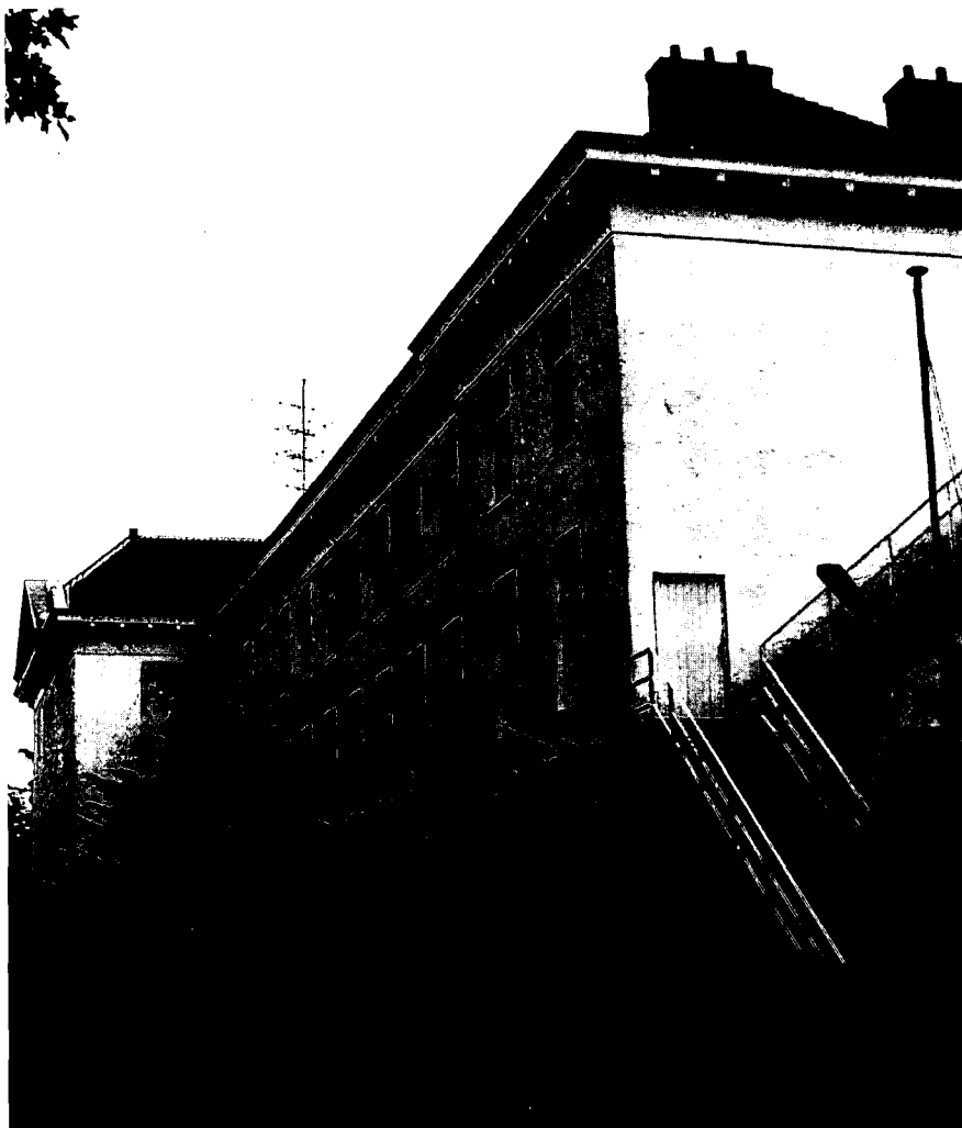
De Napoleontische vleugel langs het Geertebolwerk wordt de centraalbouw van het hotel

Tussen het nemen van de beslissing tot behoud en het opleveren van het gerestaureerde gebouw ligt vaak een lange weg. Restaureren is een proces, waarin financiële (on)mogelijkheden, de toekomstige bestemming van het object en aspecten van techniek en vormgeving veel overleg en geduld eisen van de betrokken partijen. De zojuist gestarte restauratie van het Duitse Huis in Utrecht lijkt qua aanpak een modelrestauratie voor de toekomst te worden.