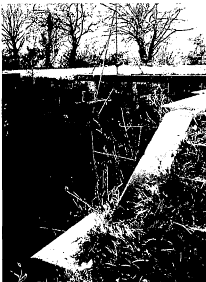
Een van de drie vervallen sluizen bij Halfweg.

Een zeldzaamheid is ook de kleine Parksluis in Rotterdam met segmentdeuren. Met enige passie spreekt