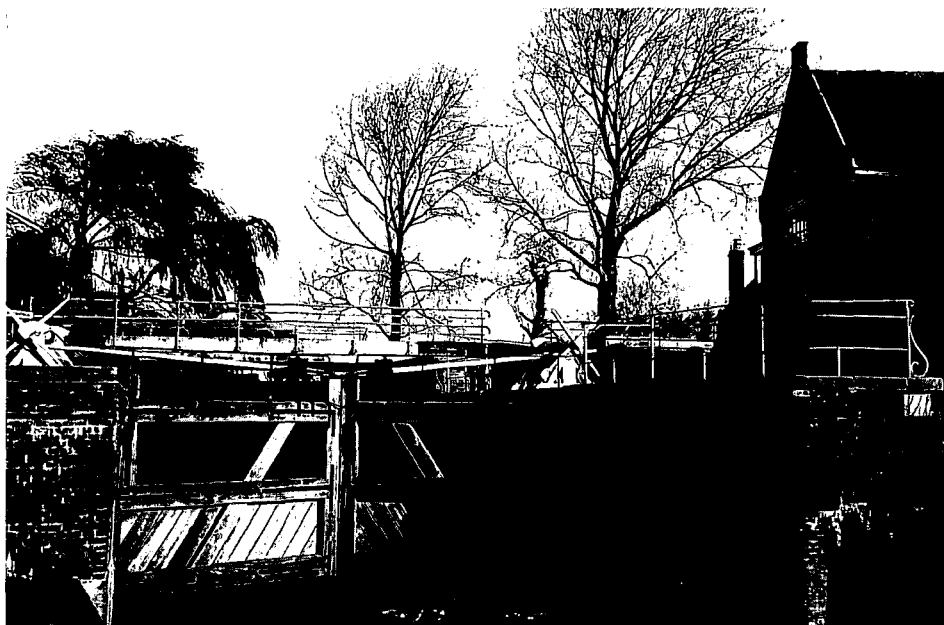
De oude sluis in Spaarndam.