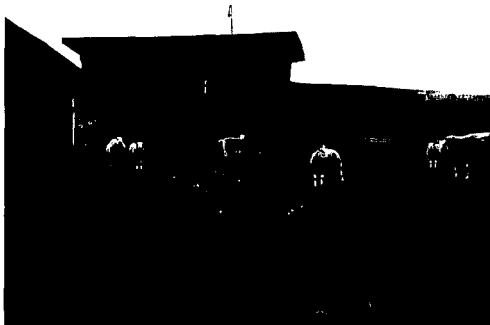
Misschien wordt het oude haltheuisje van de voormalige tram naar Schagen in oude luister hersteld.

was? Maar juist omdat het bij zo'n provinciaal dorpsgezicht in tegenstelling tot een aanwijzing door het Rijk niet gaat om een 'statistische' zaak, kan een beroep worden gedaan op het fonds voor bouwkundige verbeteringen, veranderingen aan bruggen, gevels of erfafscheidingen.