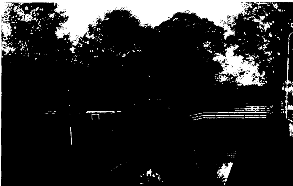
De Mient, de voorsloot. De hedendaagse bruggen worden misschien vervangen door de oorspronkelijke 'kattebruggen'.

Toen het gebied rond Schagen in de 10de eeuw er nog puur als een waddengebied bij lag, had slechts een enkeling de moed zich op één van de terpen te vestigen. In de 12de eeuw waren er al meer van die helden. Zij maakten van terp naar terp een dammetje zodat een dorp ontstond, heden ten dage nog steeds Barsingerhorn gebeten. Die oorspronkelijke verkaveling ook van het omliggende land is zo gaaf bewaard, dat de provincie Noord-Holland als eerste in den lande dorp en omgeving tot provinciaal dorpsgezicht heeft verklaard.