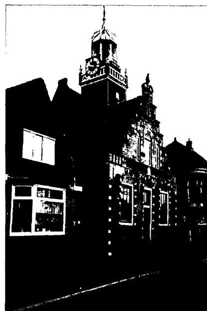
Het Regthuis uit 1632.

Een informatiepunt in het dorp zal de cultuurminnende toerist op de hoogte brengen van wat hier eens was, is en