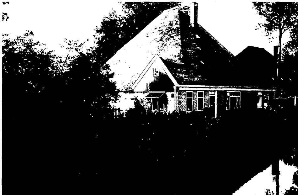
Stolphoerderij "Volhouden" bij de Blauwe Brug.