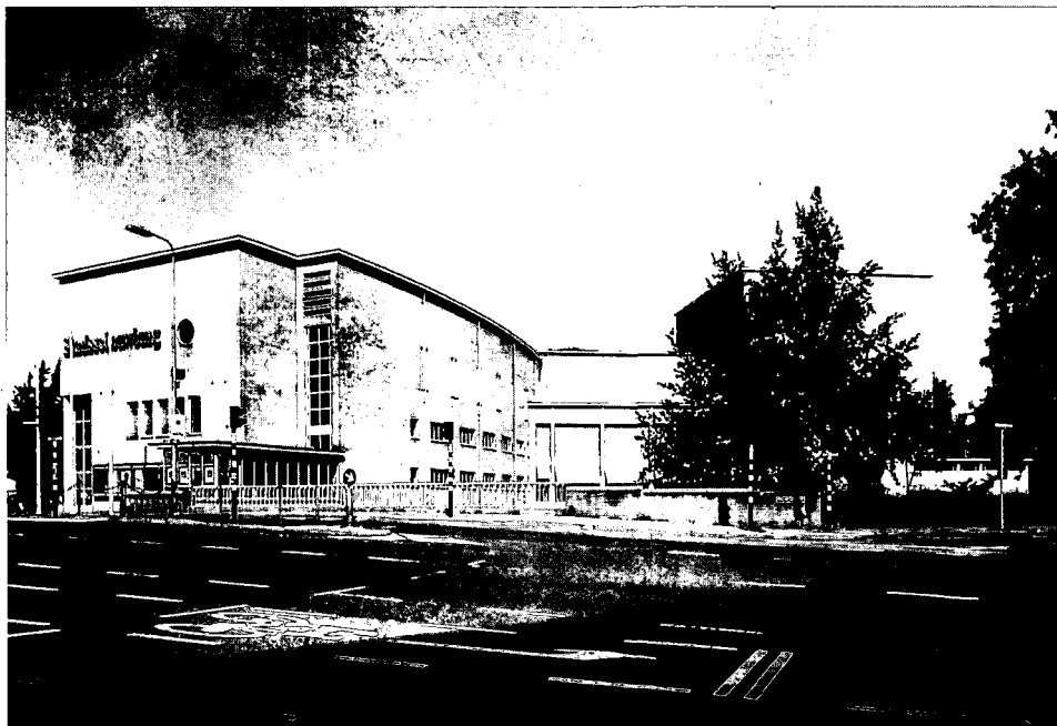
De huidige stadsschouwburg naar ontwerp van W.M.Dudok.