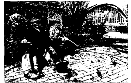
De diergaarde is een geliefd ontmoetingspunt. Op de achtergrond de Riviërahall met zijn mediterrane architectuur.

In 1986 liet architect Job de Vries een smeekbede horen om de diergaarde op de monumentenlijst te zetten. Steeds meer werd deze wonderlijke en bijzondere schepping aangetast. In 1972 was de uitkijktoren gesloopt. De theeschenkerij verdween. Het zeeleuwbassin werd aangepast. De Riviërahall kreeg een houten plafond in plaats van de strak gestucte hemel met een feestlint van lampen. Nieuwe plannen zouden de oorspronkelijke symmetrische totaalopzet van de dier-