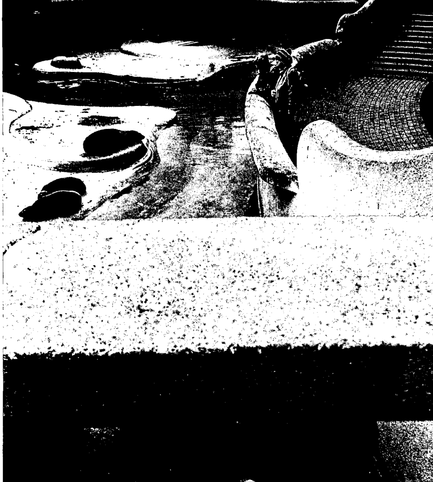
Beton maar van een expressieve kracht, een halve eeuw bepalend voor de sfeer in Blijdorp.

dat de mobiliteit niet al te groot was, elk bezoek tot een uitje. Door zijn gebouwen (als de sociëteit) en de exotische omstandigheden was de diergaarde ook een geliefd centrum van cultuur en gezelligheidsleven. Men had in de jaarverslagen niet te klagen over belangstelling, noch van individuele bezoekers noch van schoolgaande kinderen die klassikaal kwamen.