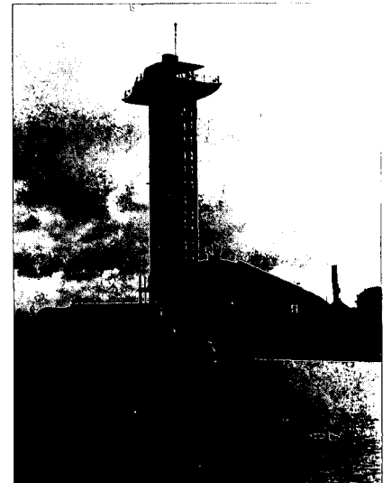
De uitkijktoren van het nieuwe Blijdorp anno 1940. Afgebroken in 1972. Een van de eerste grove aantastingen van de symmetrische architectuur en tuinaanleg van Van Ravesteyn.

Pas in de jaren '70 van de vorige eeuw kwam de explosieve groei van Rotterdam op gang. Grote infrastructuur werken als de aanleg van de Nieuwe Waterweg, doortrekking van de spoorweg dwars door de stad, aanleg van de eerste havens op Zuid lokten tienduizenden migranten. In 1907 was de oude Diergaarde Blijdorp 13,5 hectare groot en geheel ingesloten door de stedelijke bebouwing. Rotterdam telde inmiddels meer dan 400.000 inwoners. De plek in de stad, de bonte verzameling en het educatief gehalte maakten, in een tijd