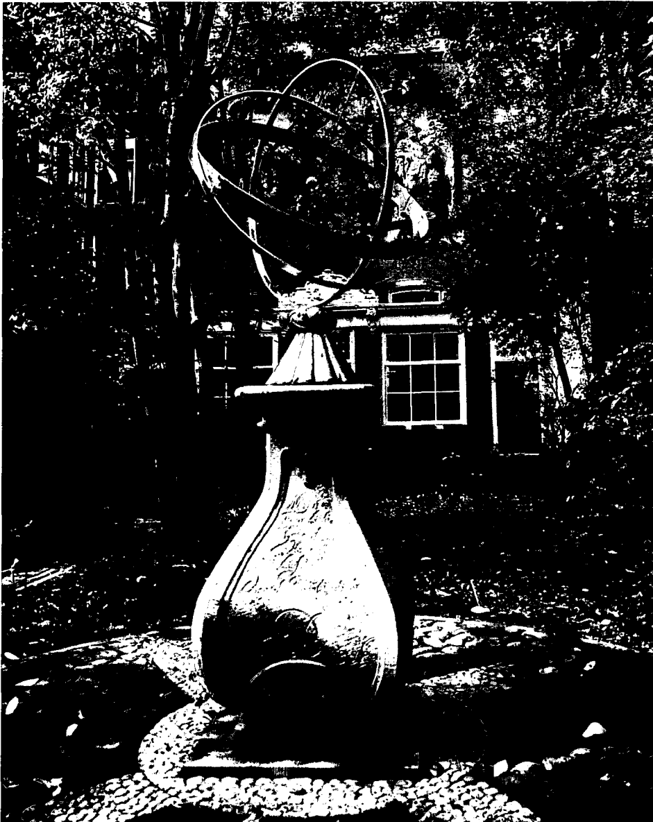
Keurblok X aan Nieuwe Spiegelstraat/Kerkstraat: gaaf gebleven.

Met het besluit van 5 maart 1613 Amsterdam uit te breiden met de grachtengordel werd de nieuwe eigenaars verboden om hier het ambacht van 'cuyperijen' en andere hinderlijke bedrijven uit te oefenen. Op de erven werd behalve het woonhuis uitsluitend de bouw van een tuinhuis toegestaan. Deze regels werden vastgelegd in de 'handvesten'; ofte 'privilegien' ende 'octroyen' mitsgaders 'willekeuren, costuimen, ordoynantien ende handelingen der Stad Amstelredam'. Tegenwoordig zijn deze beschermende regels voor de keurtuinen opgenomen in de verschillende bestemmingsplannen die voor het gebied van de grachtengordel gelden.