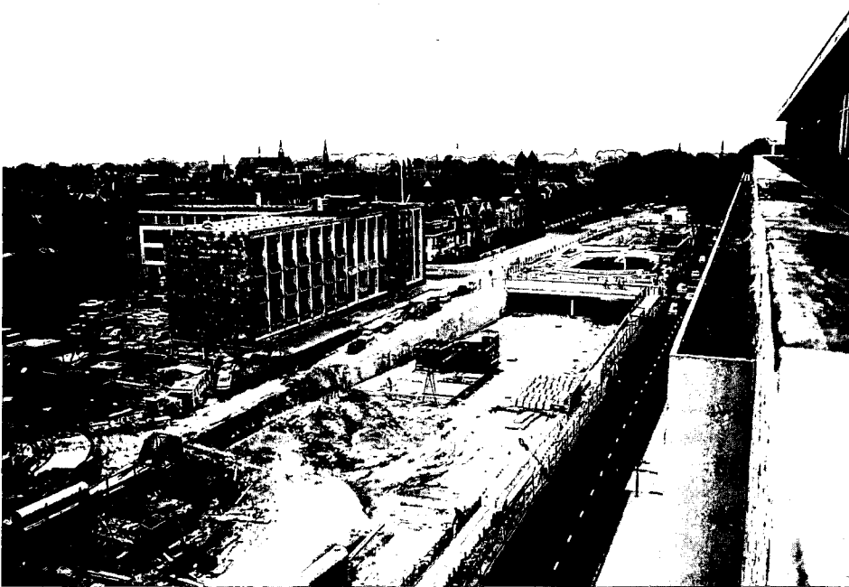
Aanleg van de Catharijnebaan in 1972. Zal de baan straks weer met water gevuld zijn?

Het is tijd voor bezinning en een wandeling over de Singels.