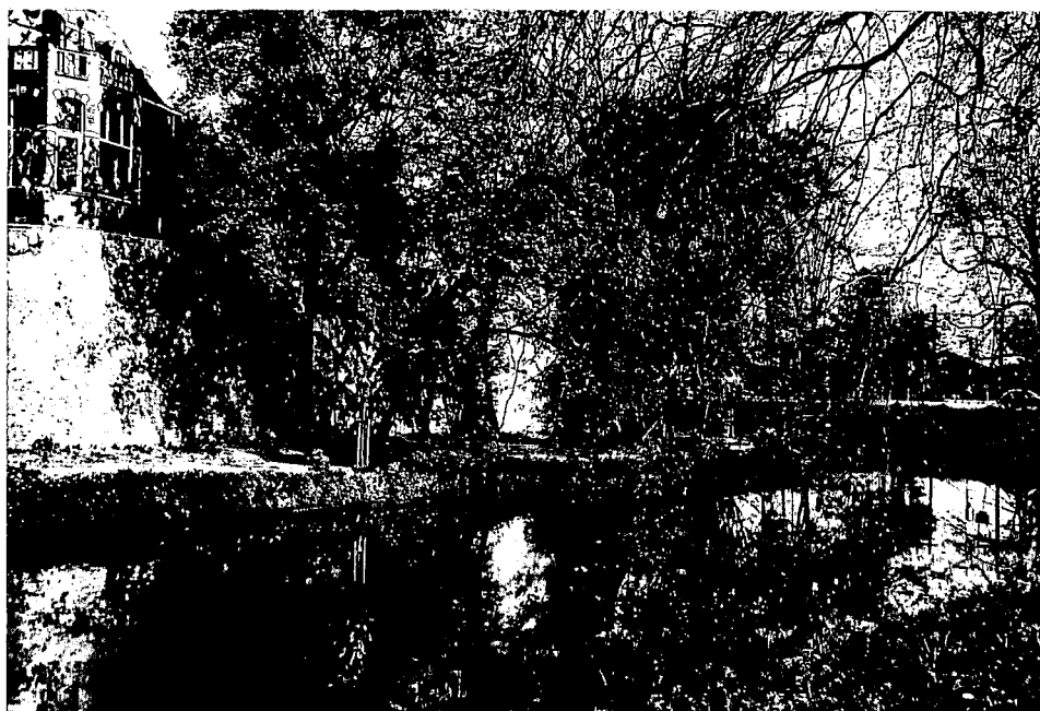
Singel bij Sonnenburg.

een betere ontsluiting van Utrecht, ook plannen voor een haven, kaden, magazijnen en eenvoudige woonhuizen, voornamelijk aan de westzijde van de stad ter hoogte van de Catharijnesingel gesitueerd. Een enorm plan waarvan slechts een klein deel werd uitgevoerd. Enkele woningen naar ontwerp van Zocher treft men aan op de Asch van Wijkckskade (1833-1839) en de Rijnkade (ca 1883). Financiële overwegingen verhinderden een verdere uitvoering van Zocher's plannen. L'Histoire se repète. De komst van de spoorwegen midden vorige eeuw zorgden uiteindelijk voor een betere ontsluiting van de stad en een verbetering van de stedelijke economie.