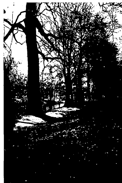
Singel met platanen.

Zocherperiode aan. Het gebied is al jaren beschermd monument. Het padenpatroon is bochtig en het terrein glooiend en rijk aan zichtassen. Rijen platanen vindt men o.a. aan het Hieronymusplantsoen en de Tolsteegsingel. Imposante linden treft men overal en ook aan de buitenzijde van de singel staan oude linden, gehinderd door het asfalt. De gemeentelijke plantsoendienst streeft naar een grote variëteit in beplanting. Er wordt regelmatig nieuw aangeplant. Na de restauratie van de muren onder de sterrenwacht is langs de waterkant een rij bloesembomen geplant. Momen-