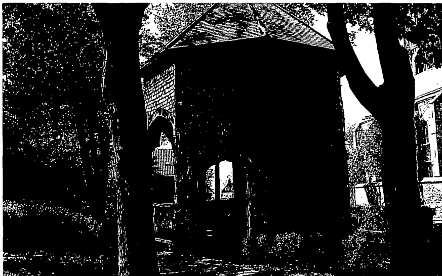
De waterput van Veere.

Koel, helder water. 'n Luxe die nu op elk gewenst moment uit de kraan stroomt. En vooral schoon water. Om te drinken, te douchen en te wassen. Dat was vroeger wel anders. Onze verre voorouders dronken water uit 'de natuur'. Direct en ongezuiverd uit beken, meren, sloten en plassen. Ze moesten soms ver lopen voor een slok. Dikwijls met ziektekiemen op de koop toe. In strenge winters was het helemaal behelpen. Dan kwam de bijl eraan te pas.