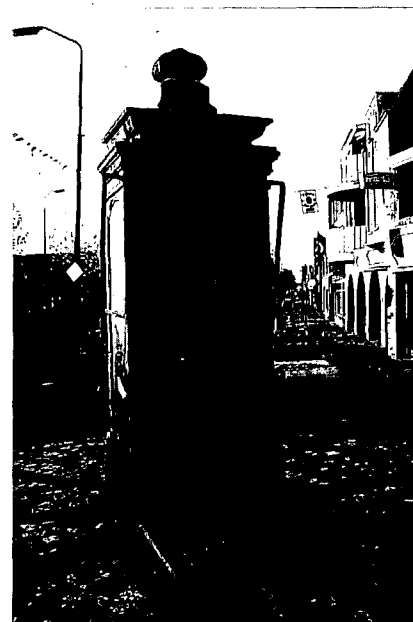
Zandstenen pomp van Rijssen met stadswapen.

De doorgaans sobere, strakke vorm van het pomphuis maakt, aan het einde van de 17de eeuw, steeds vaker plaats voor de zwierige vormen van de opkomende barokstijl. De weelderige versieringen zijn in die tijd zeer geliefd bij het publiek. Daarna komt de Lodewijk de XVI-stijl in zwang, gevolgd door de Empire. Heel bijzon-