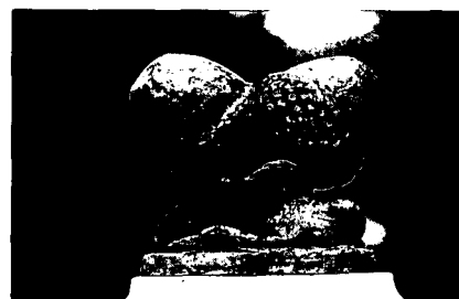
Detail pomp te Epe.

Ongeveer tegelijk met de gasverlichting kwamen gietijzeren pompen op de markt. Gietijzer leent zich bij uitstek om pompen te vervaardigen in