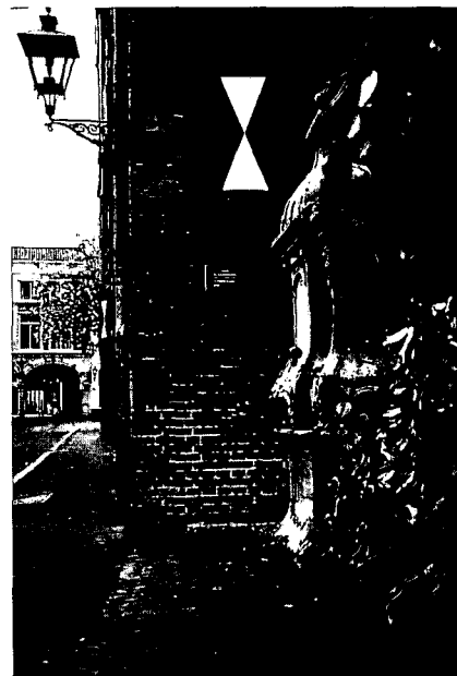
De stadspomp van Zwolle.

In de 19de eeuw waren er in Amersfoort verscheidene pompen. Al naar gelang de maatschappelijke stand, betrokken de stedelingen water uit hun eigen pomp, uit een van de stadspompen of gewoon uit de gracht! Gegoede burgers kregen op verzoek toestemming om een rechtstreekse leiding te leggen van de openbare pomp, dus eigenlijk vanaf de put, naar hun woning. Een onderzoek in 1866 naar stadspompen in de Keistad resulteert in plaatsing van enige pompen bij woningen van 'minvermogenden'. De bewoners van de Westsingel nemen, bij gebrek aan een pompmeester, het heft