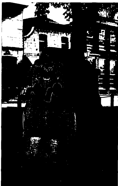
Hardstenen pomp te Heenvliet.

Op de overheid rustte de taak de drinkwaterkwaliteit te bewaken. Vooral in dichtbevolkte steden en stadjes ontstond sneller verontreiniging dan op de zandgronden en op het platteland. Kanalen, grachten en andere waterlopen fungeerden feitelijk als open riolen waarin industrieën hun afvalwater loosden. Bovendien was het destijds gewoon huisvuil in de