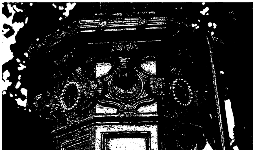
Detail rode pomp van Eenrum.

Stadspompen in Overijssel door drs. J.W.M. de Jong Stadspompen in Zwolle door J.J.A. Meyerink-Wijnbeek