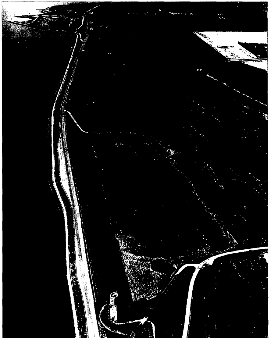
De Kouderkerksche Inlaag op Schouwen. Inlagen zijn kleine polders, ontstaan doordat men achter een zwakke plek in de zeedijk een extra dijk heeft aangelegd. De grond voor de dijk werd meestal uit de inlaag gehaald, waardoor deze een lage ligging en een hobbelig oppervlak heeft. Bij landinrichting kan t.b.v. natuurontwikkeling een eigen waterhuishouding worden gerealiseerd.

Er zullen de komende decennia grote veranderingen in de landbouw optreden, zowel wat ruimtebeslag als wat bodemgebruik betreft. In de akkerbouw is deze ontwikkeling al ingezet, zoals de bebossing en braaklegging van landbouwgronden. Naar verwachting zullen er ook in de veehouderij onder invloed van de GATT-akkoorden veranderingen gaan optreden die invloed hebben op het landschap. Een andere factor is de voortgaande verstedelijking. Volgens de plannen moeten er tot het jaar 2015 minstens