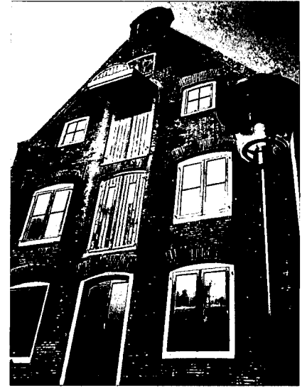
Tabakspakhuis te Nijkerk.

Om in ons land tabak te kunnen verbouwen waren bijzondere maatregelen nodig, per slot van rekening ging het om een tropische plant. Om jonge planten te kweken werden broeibakken geïntroduceerd omdat ons klimaat niet warm genoeg was om direct te zaaien. Men sprak van de 'Hollandse methode'. Ook de speciale droogschuren waren een Nederlandse vinding. Verder werden boomhagen als windvangsters opgesteld voor de perken, waarin de tabaksplanten werden geplaatst na de aanloopperiode in de broeibakken. Vooral na 1650 kwam de tabaksteelt snel op. Nijkerk werd een belangrijk centrum voor de tabaksteelt. Zo werd de Arkervaart vooral in de achttiende