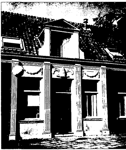
Huis met bijenkorf te Nijkerk.

de teelt van tabak. Aan het eind van de Kleterstraat, eveneens in Nijkerks centrum, vinden we 't Olde Huus, waar in vroeger dagen balen tabak lagen in afwachting van verzending. Over het algemeen vond de verwerking van de tabak in Amsterdam plaats.